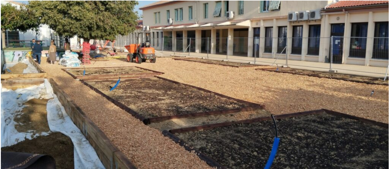
Le chantier de désimperméabilisation de l'école.