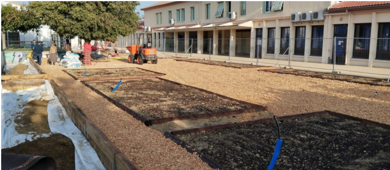
Le chantier de désimperméabilisation de l'école.