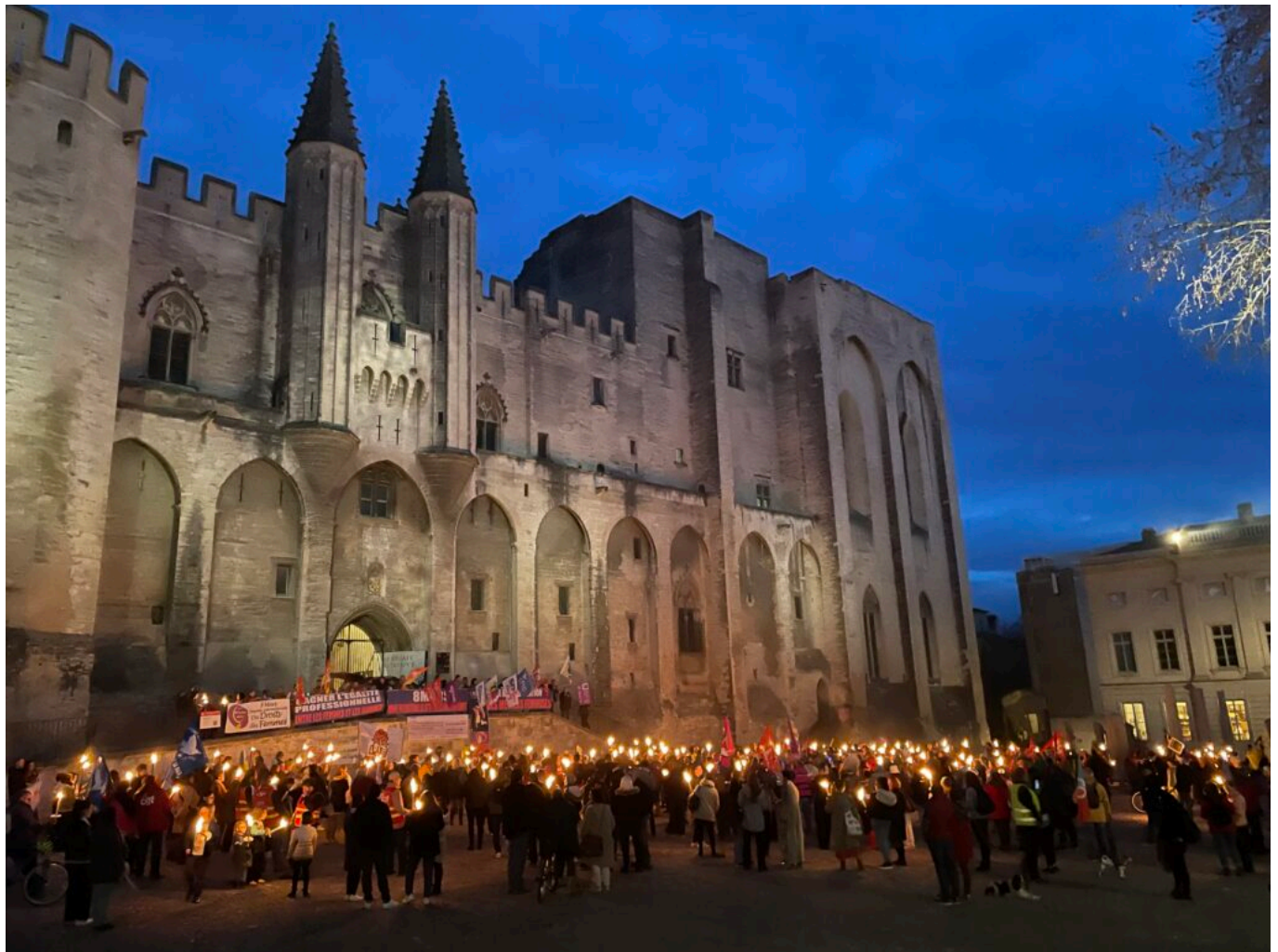
Manifestation au flambeau contre la réforme des retraites le soir du 8 mars devant le Palais des papes