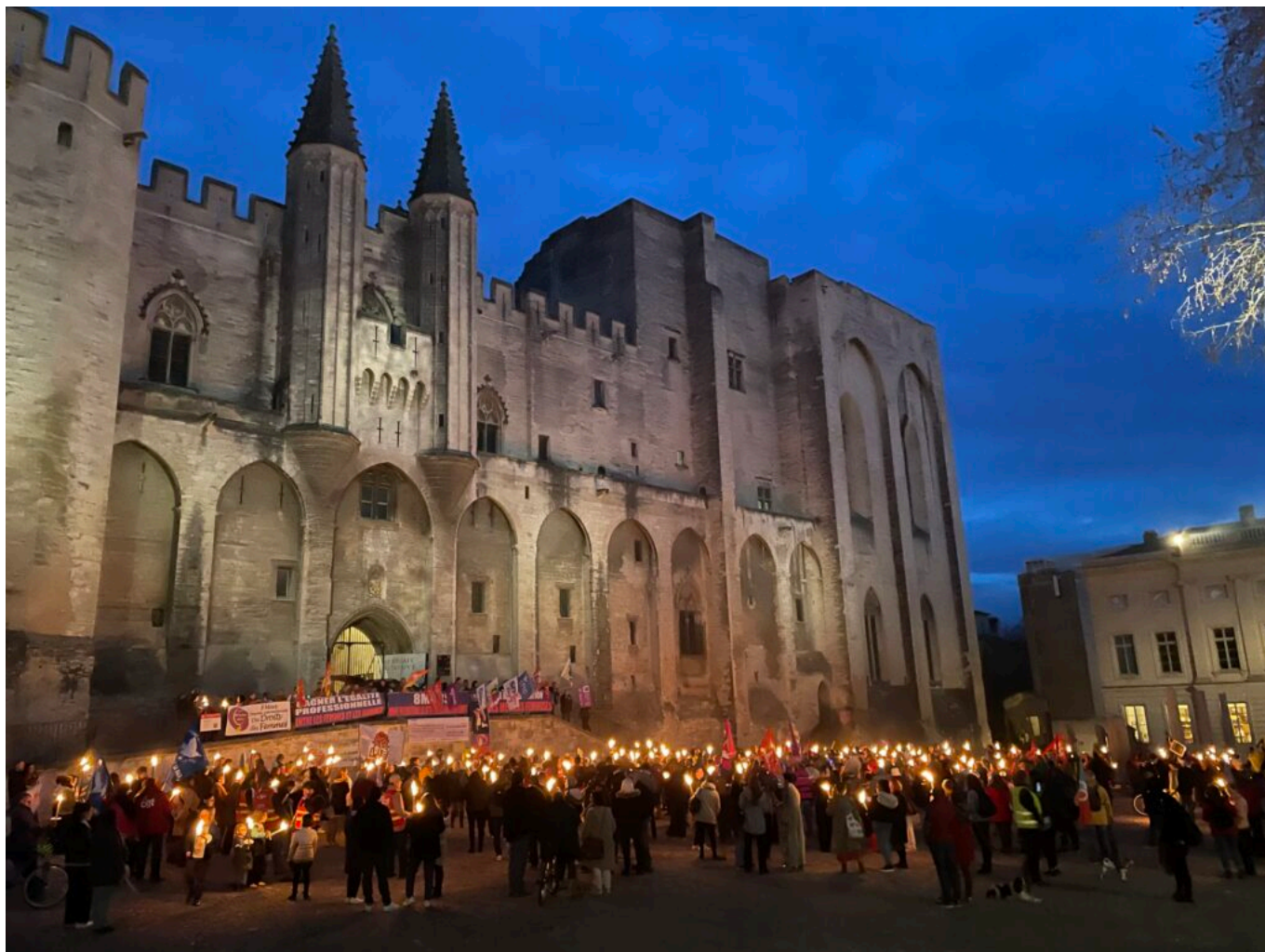
Manifestation au flambeau contre la réforme des retraites le soir du 8 mars devant le Palais des papes