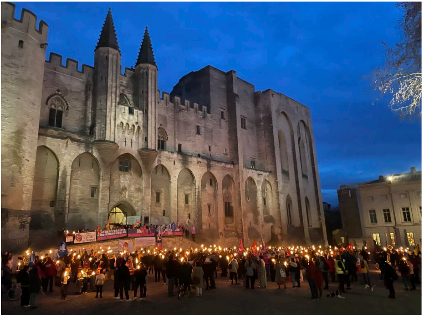
Manifestation au flambeau contre la réforme des retraites le soir du 8 mars devant le Palais des papes