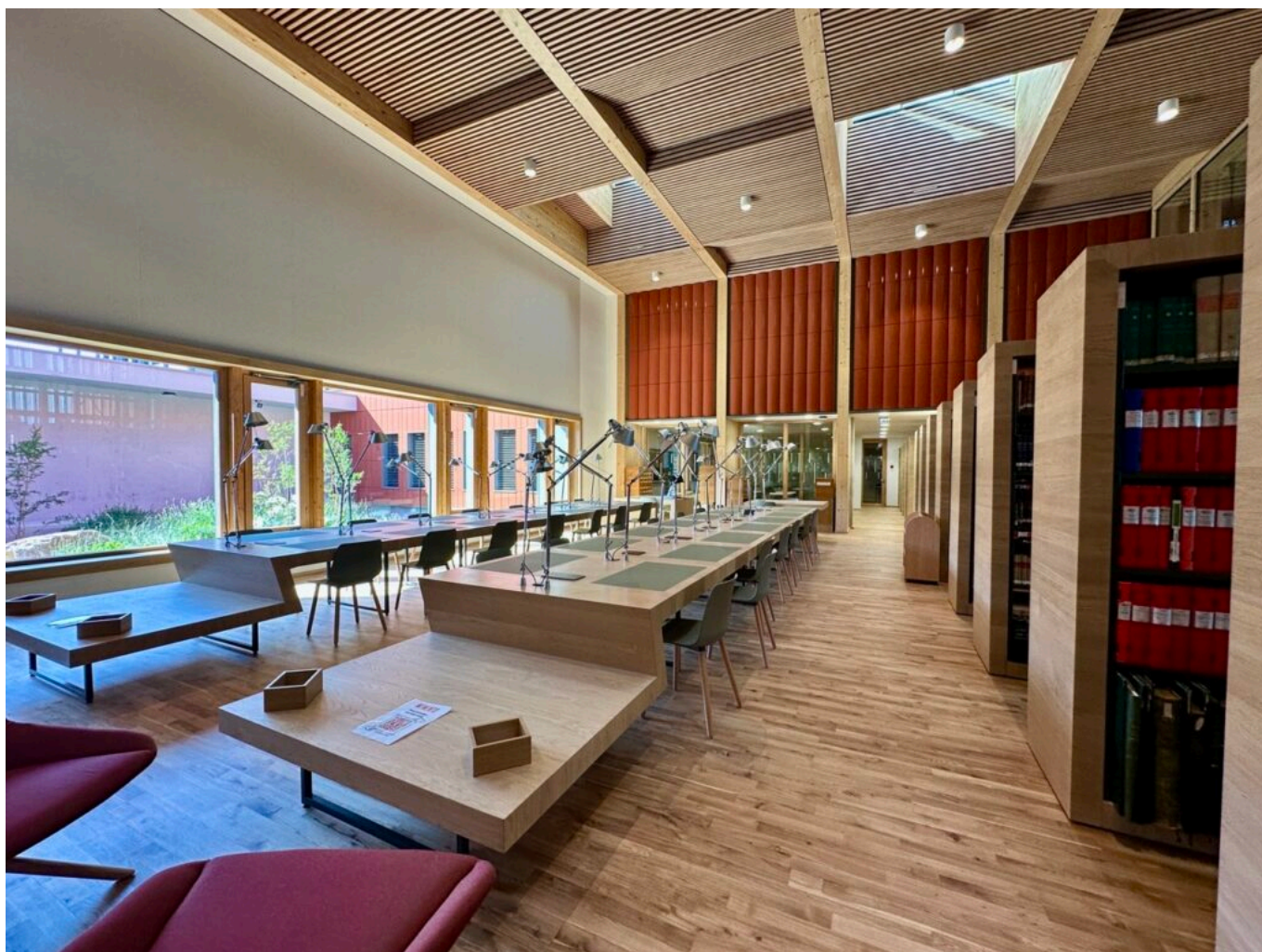
La salle de lecture

Ecrit par Vanessa Arnal-Laugier le 29 mai 2026