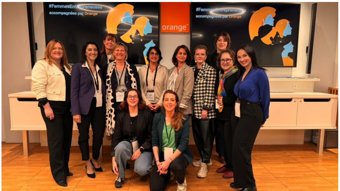
Femmes entrepreneuses saison 7 Copyright Orange Avignon

Depuis son lancement en 2018, plus de 700 femmes entrepreneuses ont été accompagnées par Orange dans toute la France. Le programme cible des start-ups technologiques : intelligence artificielle, cybersécurité, Web3, IoT (Internet of things, interconnexion entre un réseau d'objet et de terminaux connectés équipés de capteurs et d'autres technologies permettant de transmettre et de recevoir des données entre eux)... avec des fondatrices majoritaires ou cofondatrices à forte utilisation ou maîtrise de la tech.