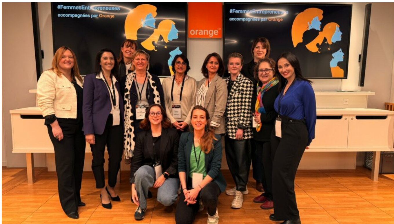
Femmes entrepreneuses saison 7

Depuis son lancement en 2018, plus de 700 femmes entrepreneuses ont été accompagnées par Orange dans toute la France. Le programme cible des start-ups technologiques : intelligence artificielle, cybersécurité, Web3, IoT (Internet of things, interconnexion entre un réseau d'objet et de terminaux connectés équipés de capteurs et d'autres technologies permettant de transmettre et de recevoir des données entre eux)... avec des fondatrices majoritaires ou cofondatrices à forte utilisation ou maîtrise de la tech.