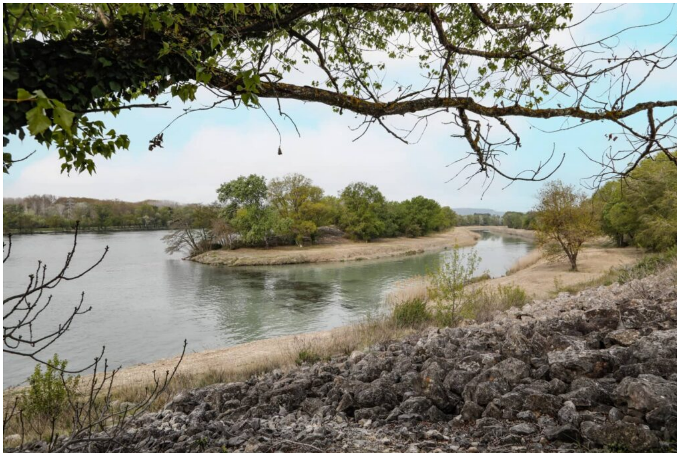
HOCQUEL A - VPA

En novembre dernier, le Syndicat des eaux Rhône Ventoux a organisé une conférence 'Ensemble relevons les défis du manque d'eau' à Mazan. L'occasion de partager autour de l'impact du changement climatique sur l'eau après un été sous le signe de la sécheresse.