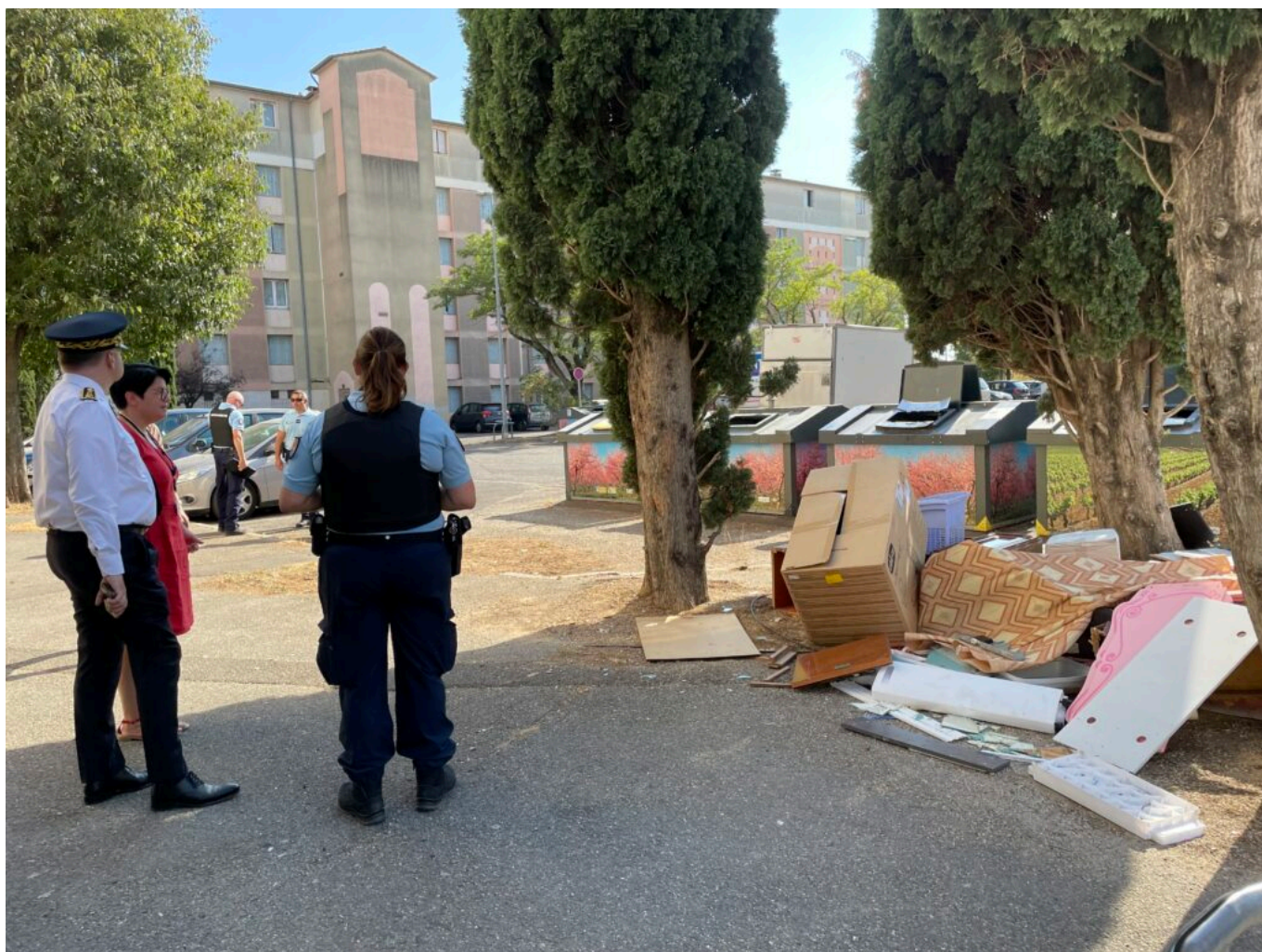
Cité l'Establet à Sorgues, patrimoine de Vallis Habitat

Ecrit par Mireille Hurlin le 16 août 2022