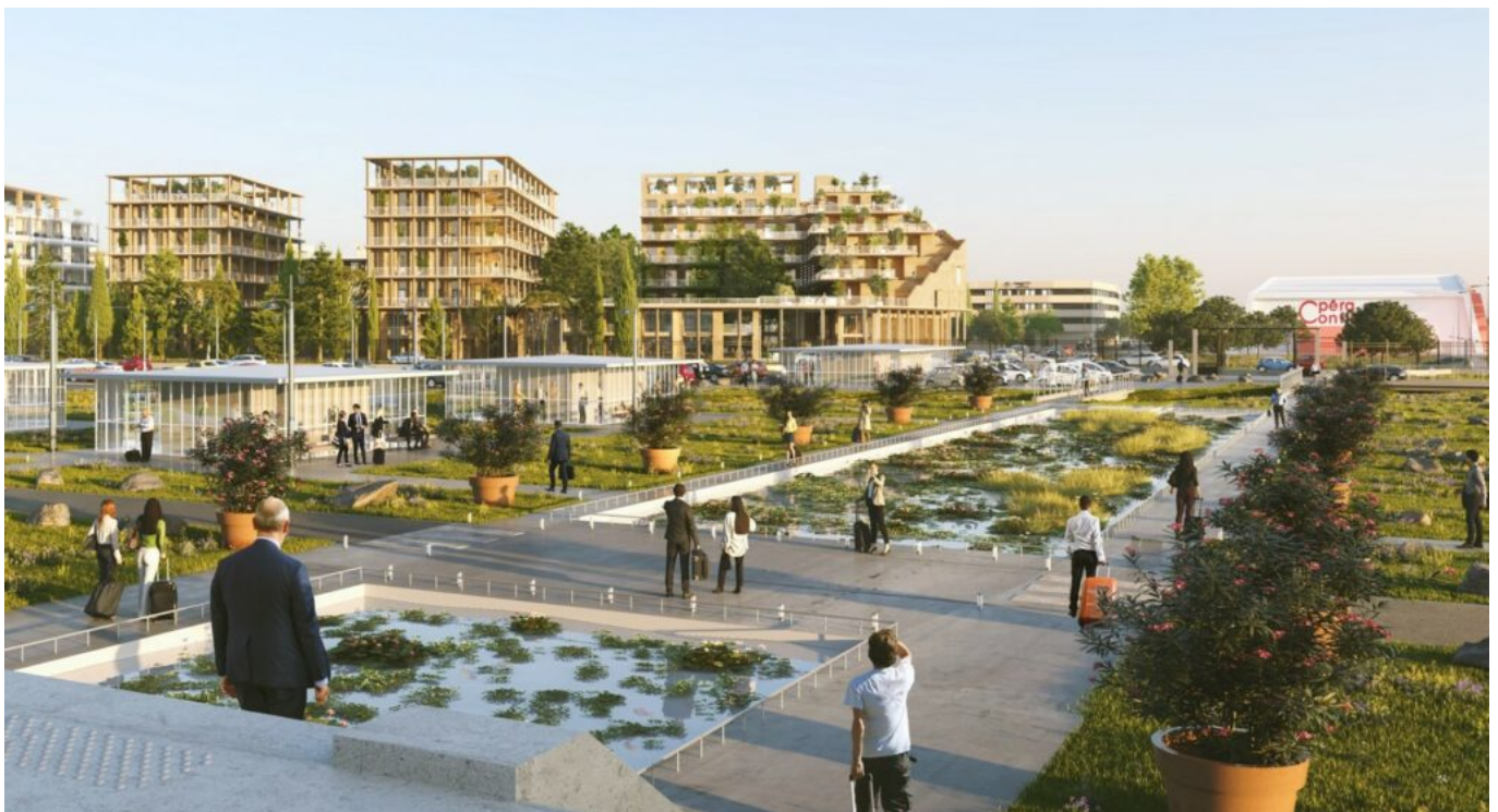
Le 1er macro-lot d'Avignon-Confluences vu depuis le parvis de la gare. ©Leclercq Associés &

Il faut dire qu'en guise de cadeau d'adieu, beaucoup pointent du doigt en 'off' une ministre, aussi rancunière que malheureuse après des élections municipales perdue à Avignon en 2001, d'avoir eu 'la bonne idée d'œuvrer' à ce que l'évaluation des risques d'inondation ne soit plus estimée par rapport à une crue centennale mais par rapport à une crue millénaire. Et histoire de bien verrouiller l'affaire, outre le Rhône, ce risque avait été aussi étendu à la Durance. Pas étonnant dans ces conditions que les programmes apparaissent au compte-gouttes et qu'il soit difficile de réaliser des projets d'envergures comprenant notamment un geste architectural emblématique.