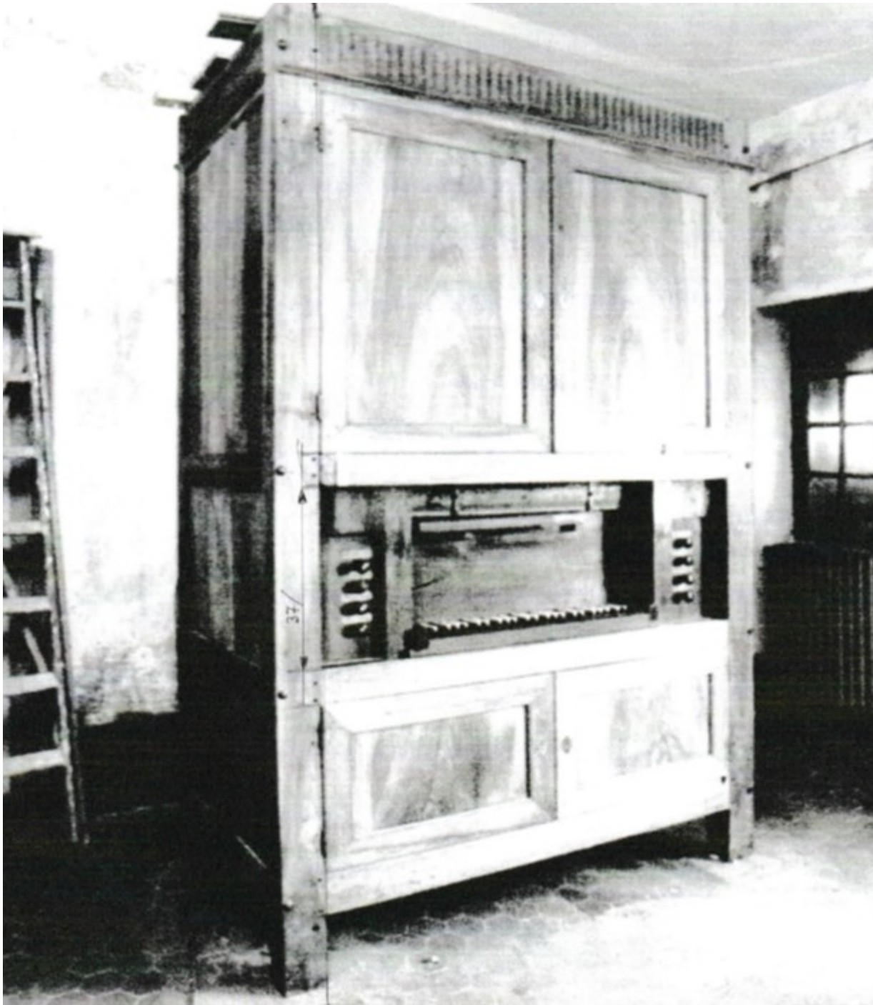
Ancienne photographie de l'orgue de Valréas.