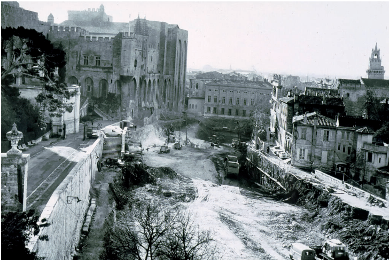
La construction du parking du palais des papes.

La décennie suivante : caserne des pompiers de Fontcouverte, gare routière d'Avignon, réalisation de la percée Favard, Agroparc avec l'installation de la Chambre d'agriculture ainsi qu'un IUT et un IUP, résorption de l'habitat insalubre dans le secteur Philonarde à Avignon, ZAC de la Charbonnières à Villeneuve-lès-Avignon ou bien encore destruction des barres de Champfleury à Avignon seront au menu des années 1980-1989.