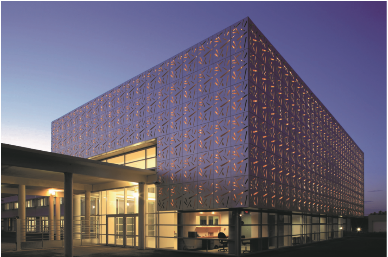
Le collège de Cavaillon.