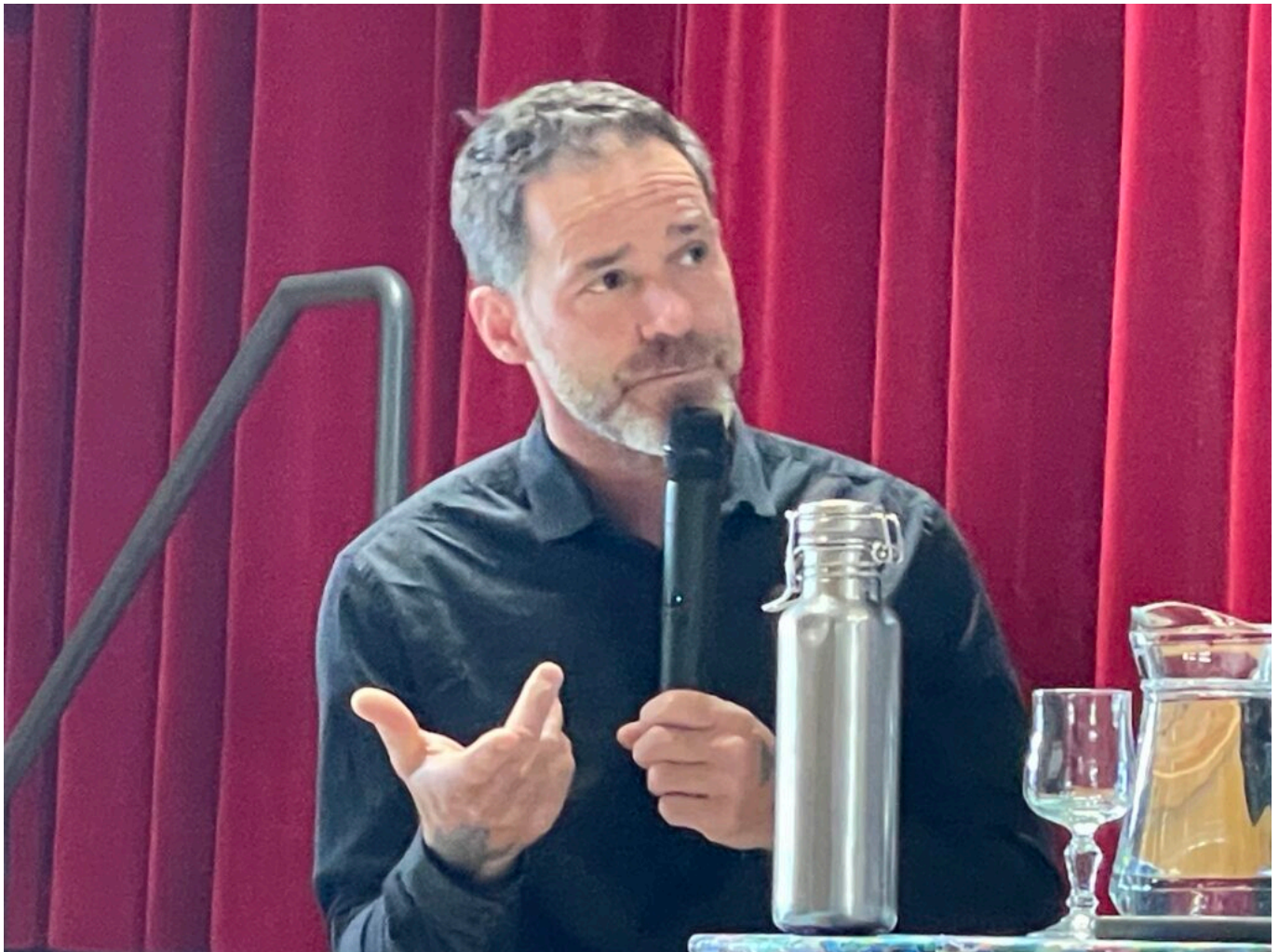
Jérémie Pichon

Ecrit par Mireille Hurlin le 25 mars 2025