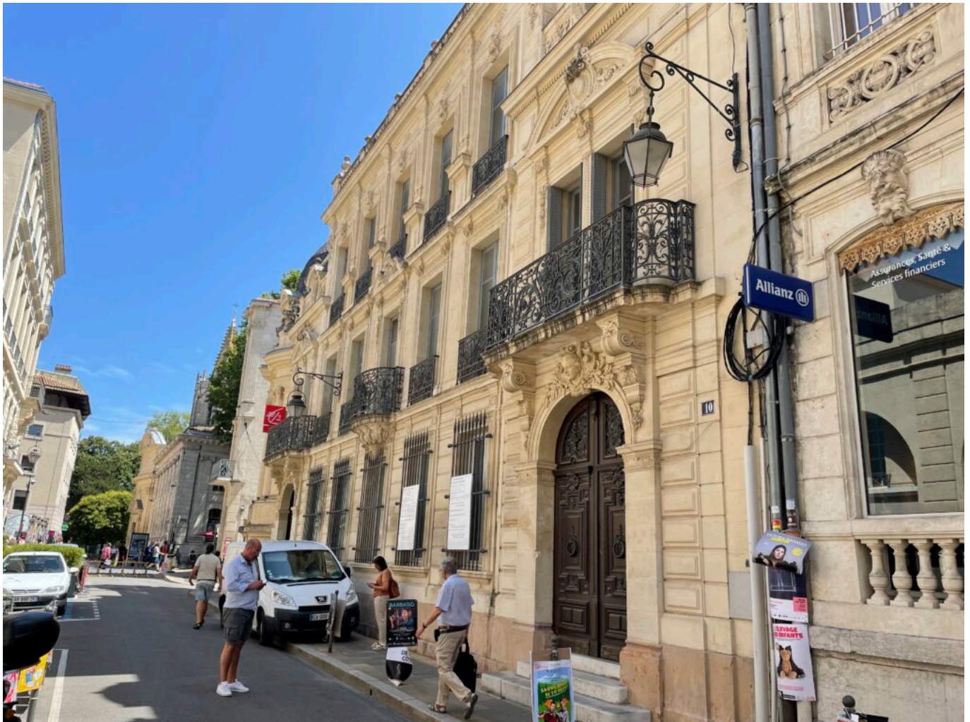
Vue actuelle de la rue