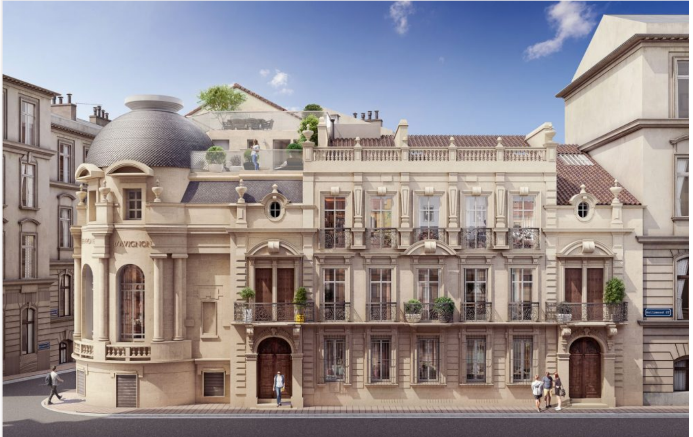
Vue d'ensemble DR Cabinet d'architecture Fluor

«La réhabilitation de la Maison du Chevalier Folard en 14 logements a pour objectif architectural un minimum d'impact sur rue et une requalification cohérente de mise en valeur de l'espace sur cour, lit-on sur le site de d'architecture Fluor . Cette cour protectrice du vent et du soleil de Provence est transformée grâce à une résille métallique implantée en applique des coursives existantes. Le dessin savant de cette résille répond à la logique de composition d'Architecture Eclectique du XIXe de la façade rue Joseph Vernet. Les espaces extérieurs sont généralisés à l'ensemble des logements par la cour, les coursives, les balcons et la création de 3 terrasses autour du dôme zénithal emblématique. Le platane centenaire habite la cour de sa présence bienveillante.»