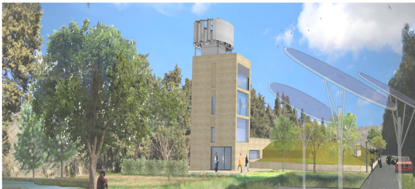
La Tour des vents, projet seul sur Mars