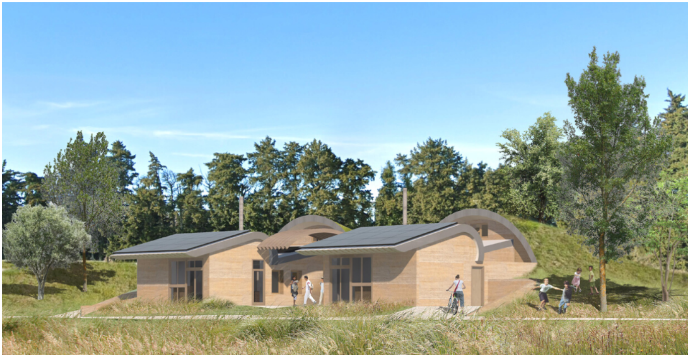
Les Marsupiennes, projet Seul sur Mars