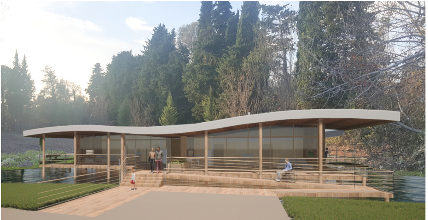
L'Isle solaire, projet Seul sur Mars