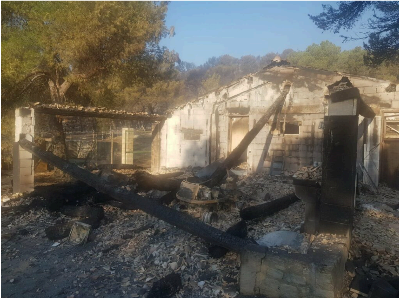
Dégâts constatés par la commune de Barbentane.