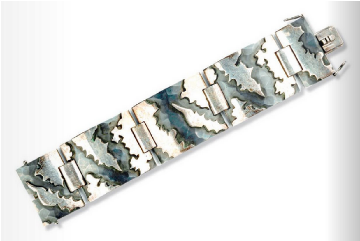
Bracelet Jean Després lot 334