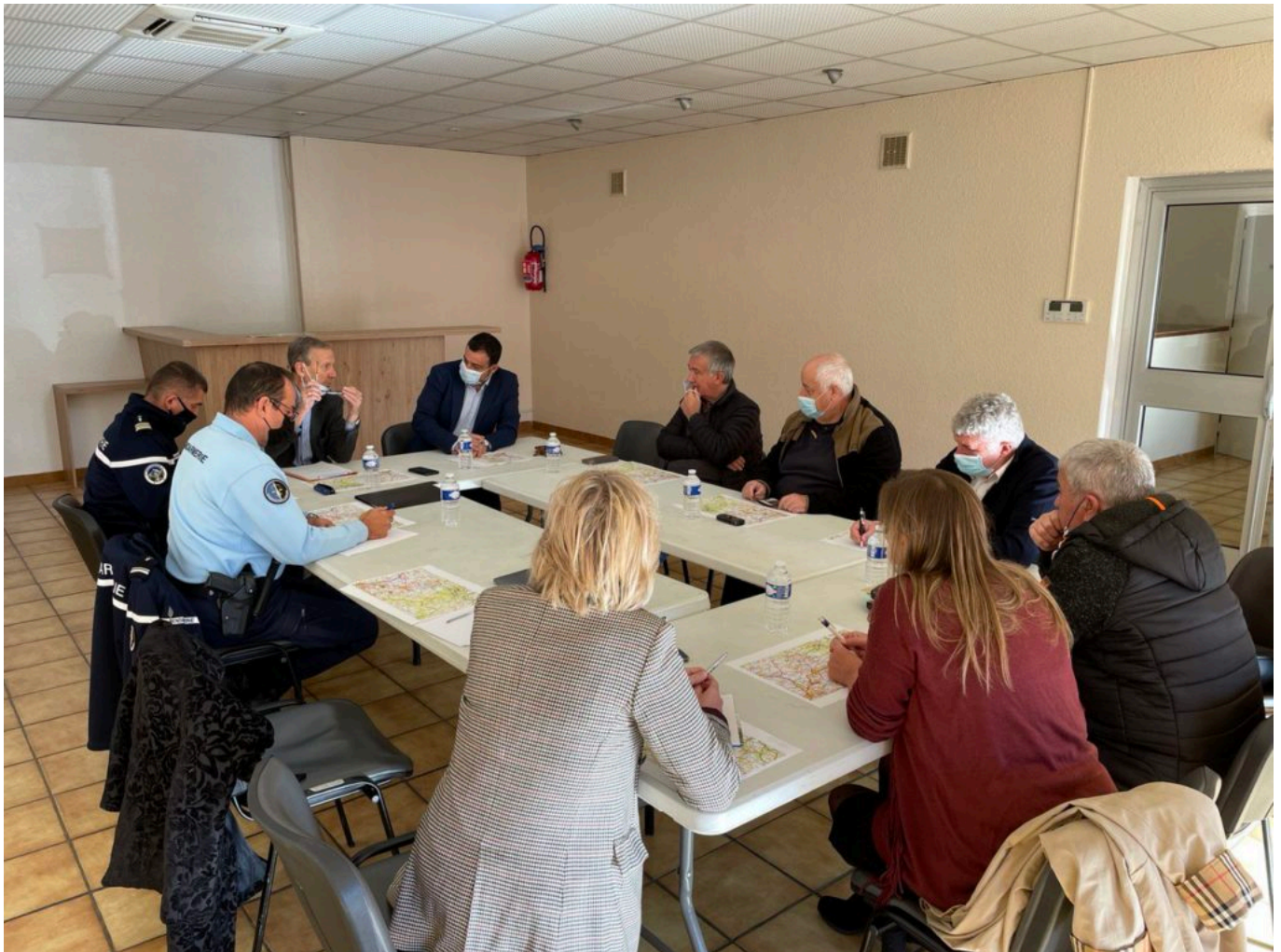
Réunion du vendredi 5 novembre autour de la déviation de Mazan