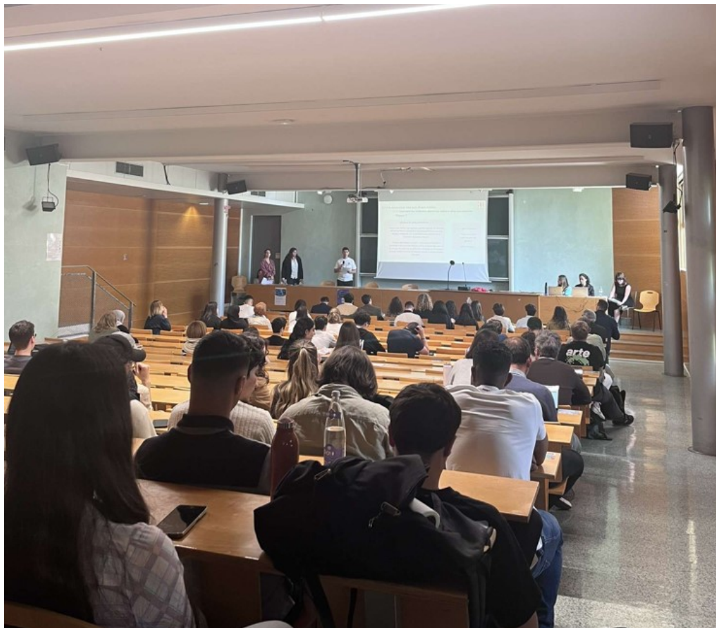
Durant la présentation de l'étude à l'université d'Avignon.

« règles caractéristiques, on est loin des clichés de violence véhiculés par les médias, il y a un réel élan de solidarité » assure Alexandre, un des étudiants ayant participé à l'étude.