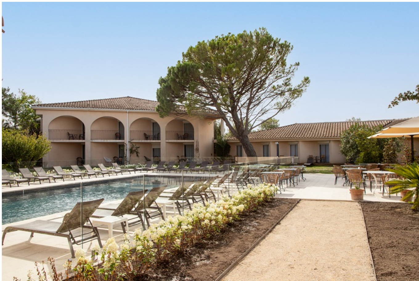
L'hôtel Golden Tulip Le Paradou à Avignon.