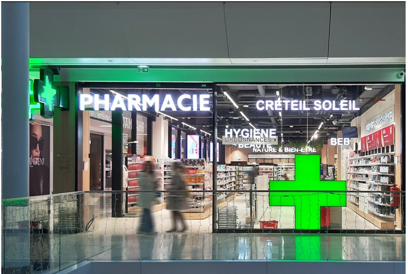
Exemple d'intervention sur une pharmacie

«J'étais salarié chez Michelin et, dans ce groupe important, totalisant plus de 140 000 salariés, je savais que je n'aurais pas accès à l'actionnariat. Mais le fait d'y travailler m'avait donné envie d'observer l'actionnariat dans le fonctionnement de l'entreprise. Quel impact celui-ci pouvait avoir dans la gestion d'une entreprise, en dehors d'une gestion dite familiale.»