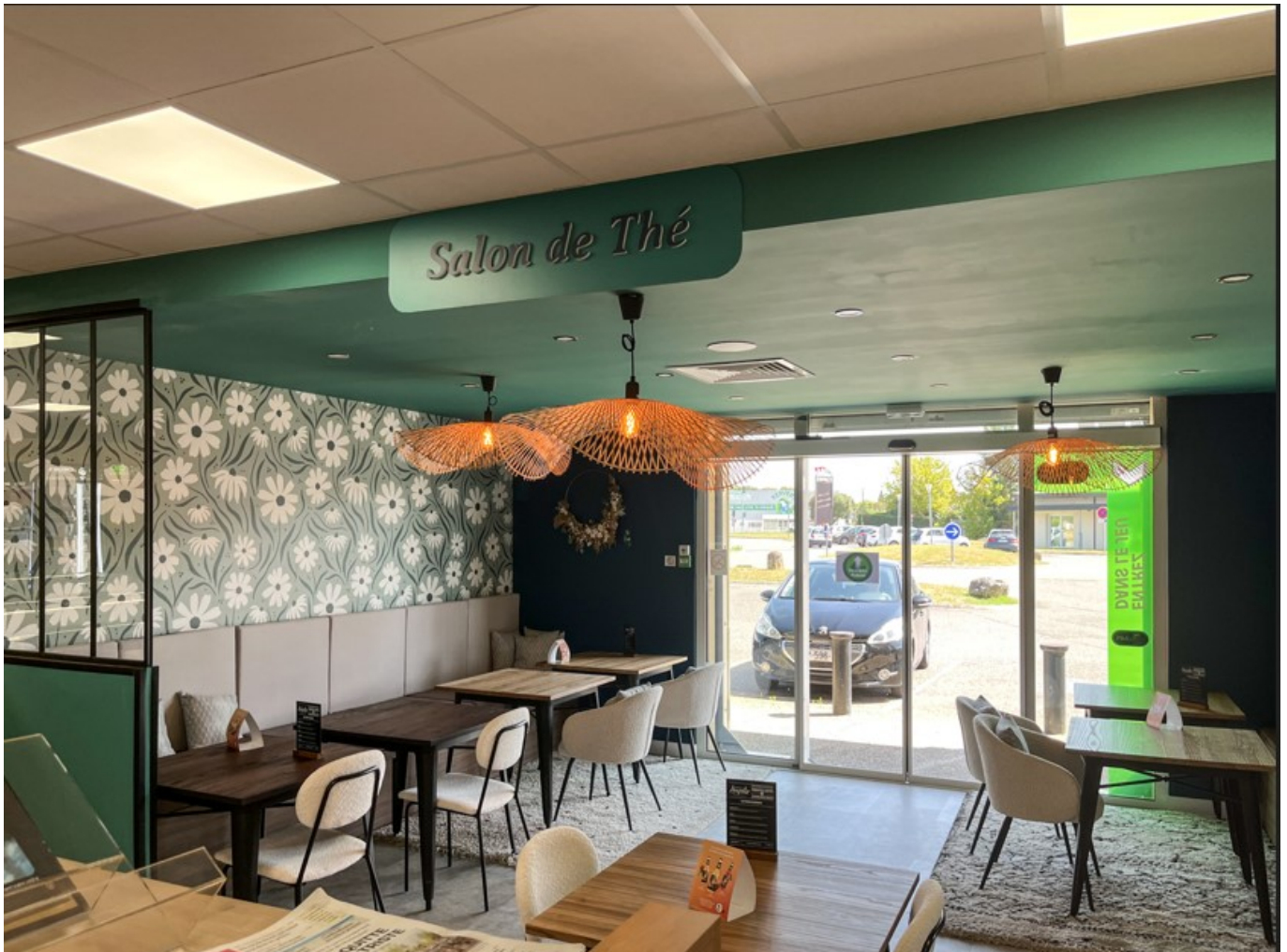
Conception d'un espace tabac-presse- salon de thé.