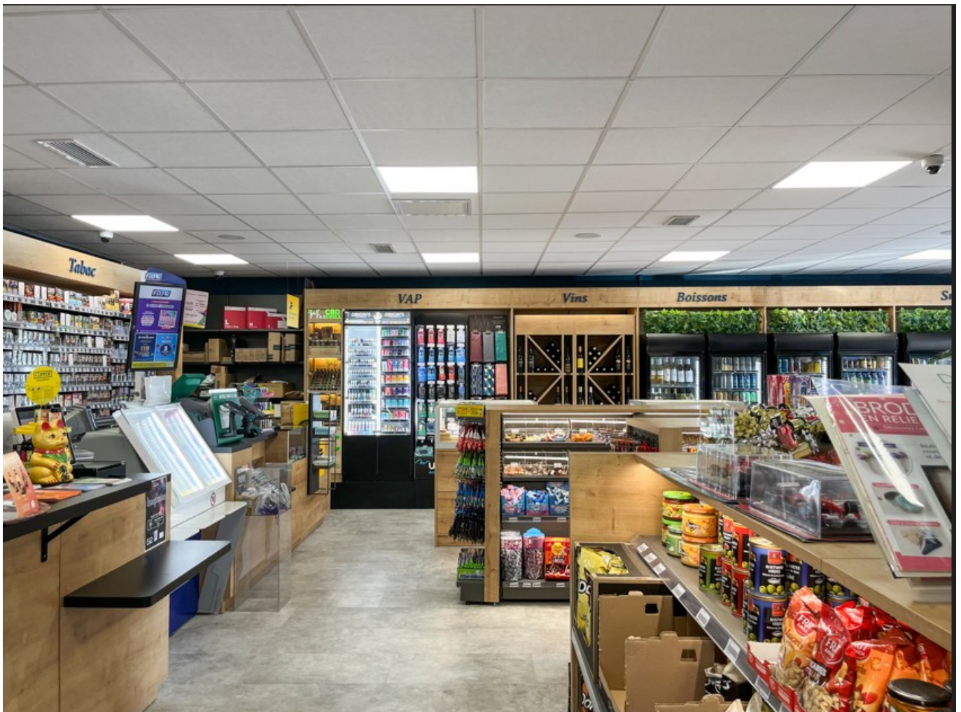
Conception d'un tabac presse

«Ce sont des agenceurs de pharmacie plutôt régionaux ou nationaux. Il y a également des menuisiers mais qui ne sont pas, dans ce cas, des spécialistes. Le marché de l'agencement est surtout devenu de plus en plus complexe avec l'implantation de robots qui optimisent le stockage et réalisent la distribution automatique des médicaments et dont il faut tenir compte dans l'agencement et les contraintes réglementaires et les engagements de l'État. En étant spécialistes, nous apportons une écoute et une pertinence à nos clients, nous nous adaptons et nous apportons des solutions aux spécificités du marché, actuelles et également tendancielle.»