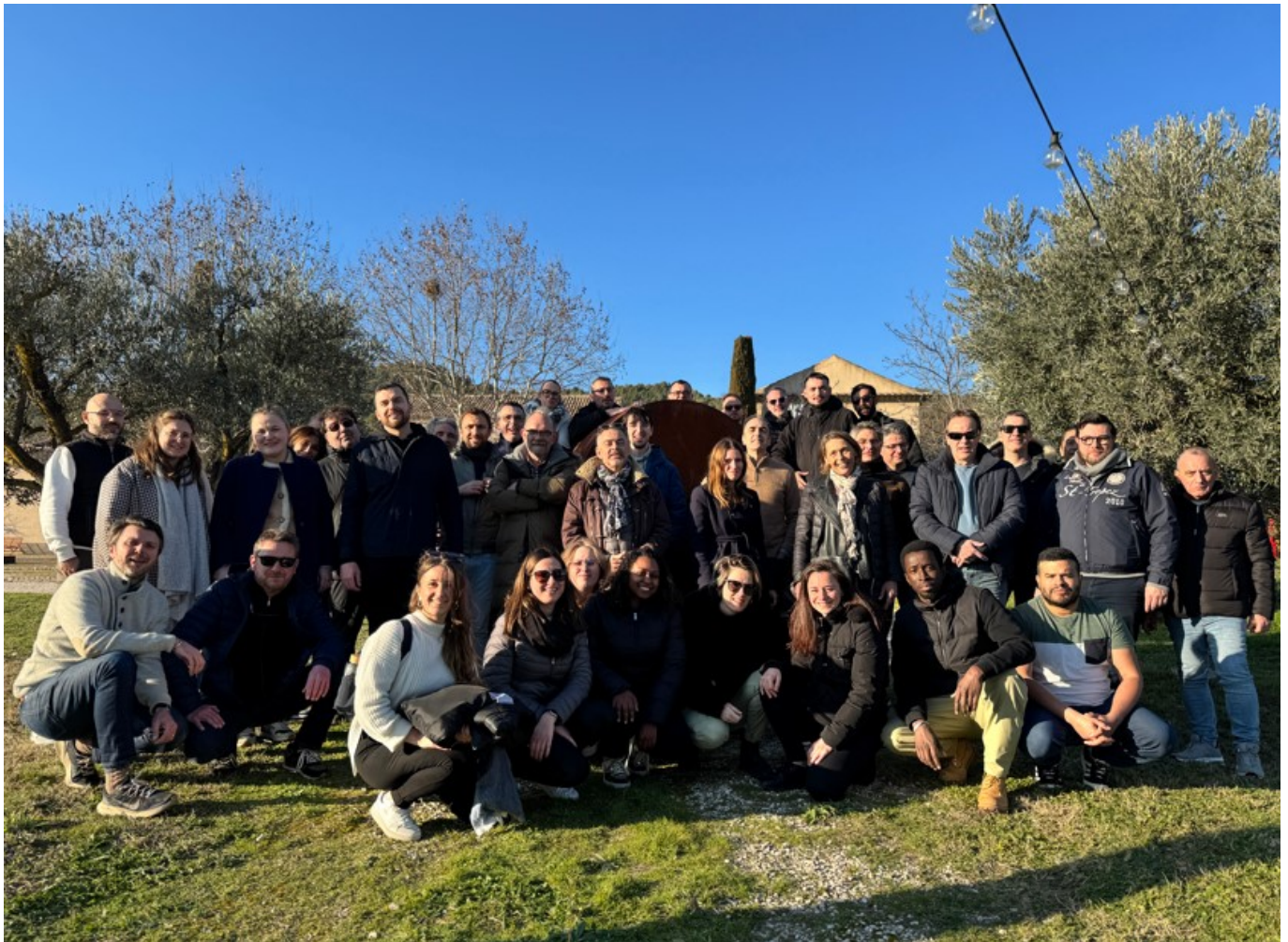
L'équipe Proespace groupe

«Nous devons l'accroissement de notre chiffre d'affaires à une stratégie de développement géographique et de marchés de spécialités. Aujourd'hui nous sommes dans une logique de stabilisation du chiffre d'affaires puisque nous avons renforcé notre bureau d'études et nos équipes de vente. Il y a donc ce temps de digestion avant de croître à nouveau.»