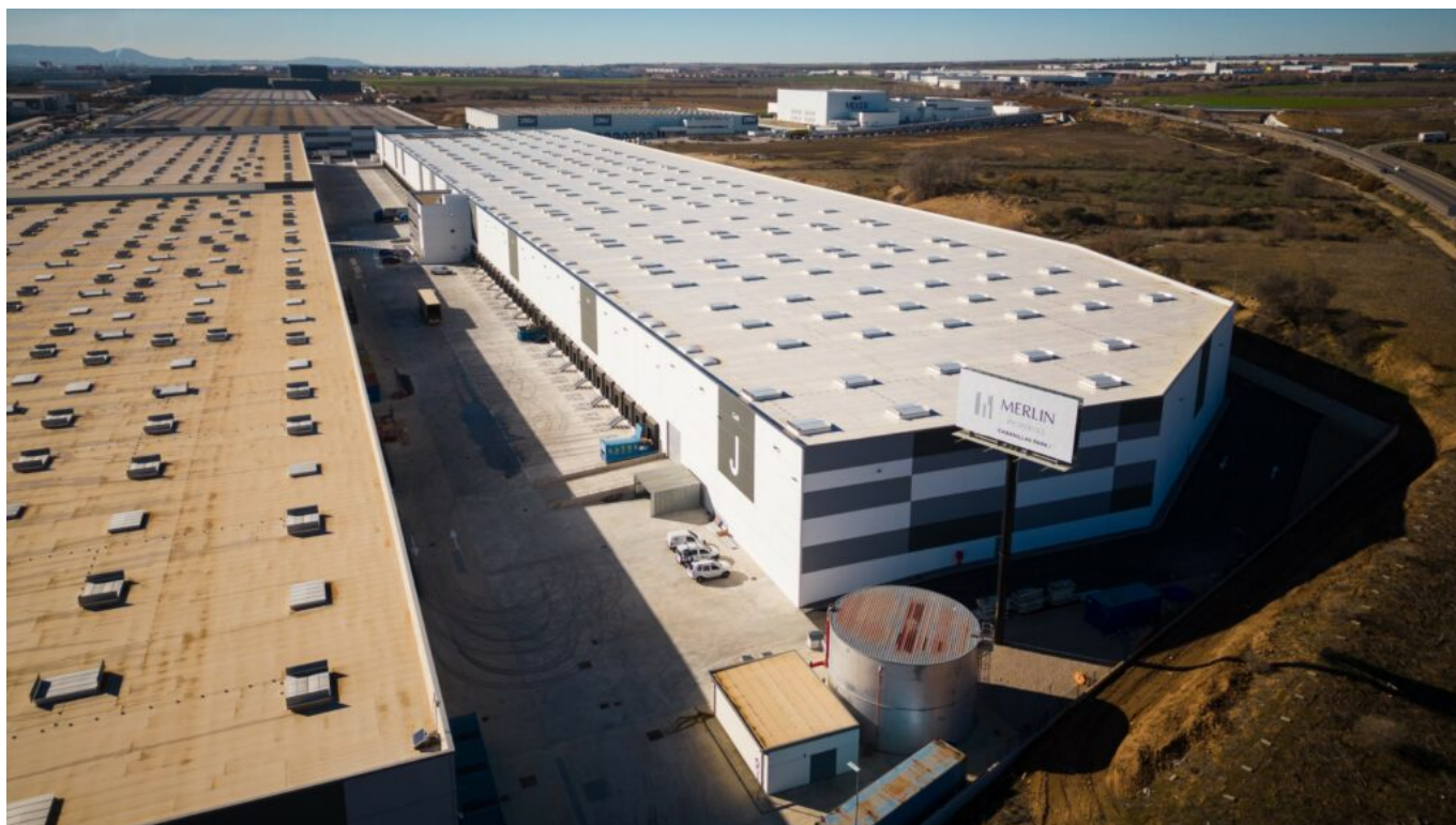
Nouvel entrepôt logistique pour MERLIN Properties à Madrid