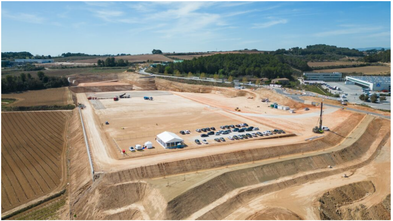
Site du futur ensemble logistique pour GLP à Barcelone

« Ces deux nouveaux projets témoignent du dynamisme de notre activité en Espagne et de la forte implantation de GSE sur le marché ibérique », souligne Ramón Lazaro. « Le marché de l'immobilier logistique est particulièrement dynamique en Espagne avec une forte croissance ces dernières années, poussée par une demande importante en partie portée par le développement e-commerce ».