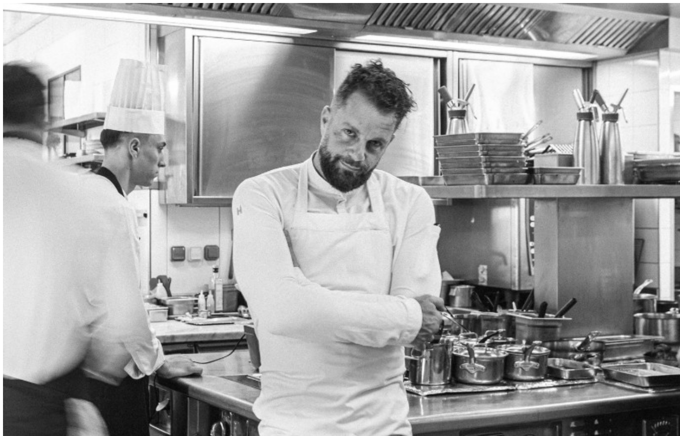
Florent Pietravalle Copyright Facebook