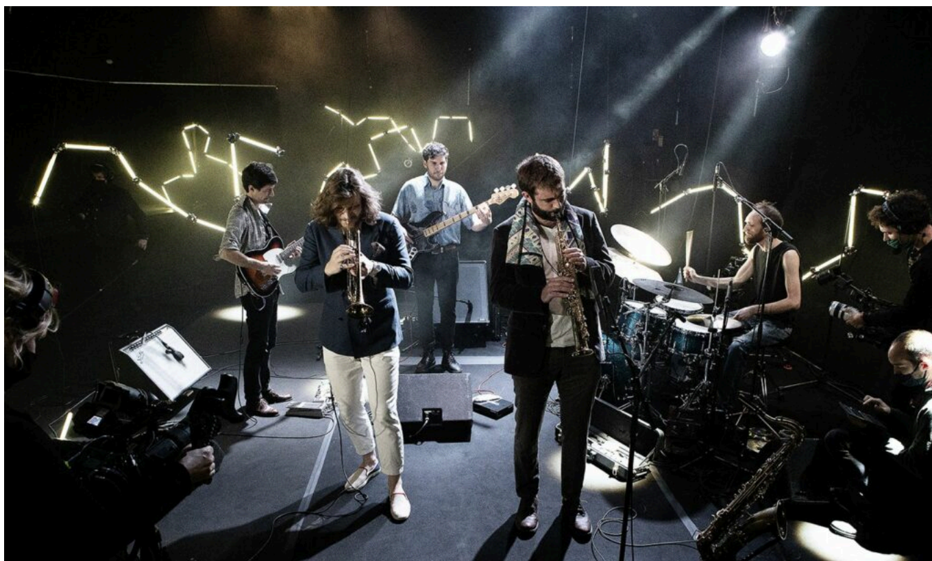
Go to the dogs