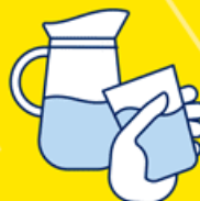
BUVEZ DE L'EAU