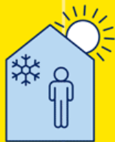
RESTEZ AU FRAIS