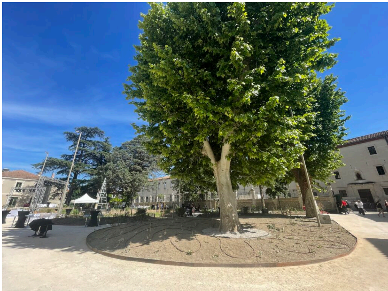
Partie des jardins de la Villa créative

Un dôme monumental, prévu pour septembre 2025 dans le jardin de la Villa Créative, incarnera cette vision d'une architecture durable et spirituelle, rétablissant le lien entre humains et écosystème. Côme Di Meglio développe, dans le cadre de S+T+ARTS, des architectures immersives en mycélium alliant design bioclimatique et contemplation. Favorisant bien-être et interactions sociales, le projet vise à réduire les coûts de fabrication pour diffuser largement ces structures grâce à une méthode innovante.