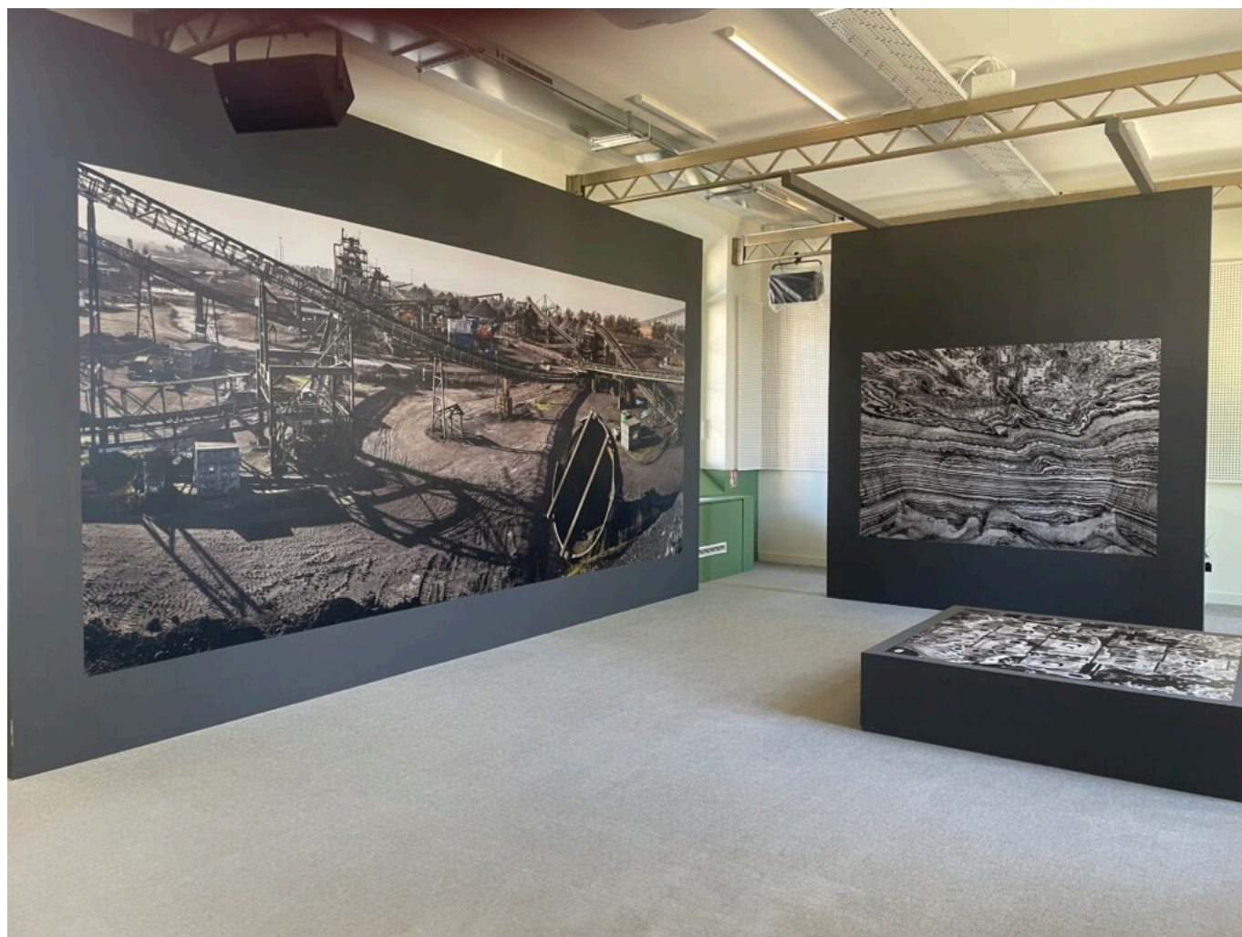
L'exposition d'Edward Burtynsky

La Villa Créative lance chaque semestre, en octobre-novembre et janvier-février, une campagne d'appel à projets : artistes, chercheurs, associations, collectifs, institutions sont invités à candidater. Les Collèges artistiques et scientifiques de la Villa Créative se réunissent à l'issue de l'appel pour étudier chaque candidature et potentiellement l'intégrer à l'écosystème de la Villa Créative - en l'associant à des programmes de recherche, en cours de développement à travers des résidences protéiformes, accueillies dans cet espace hybride. La 1 ère année La Villa créatrice a compté 1 000 consultations de l'appel et réceptionné 120 candidatures. Enfin, La brasserie, écoresponsable, propose l'inclusion, donne à travailler et servir des produits locaux, équitables, provenant de circuits courts et à bas coûts carbone. C'est aussi un restaurant d'application.