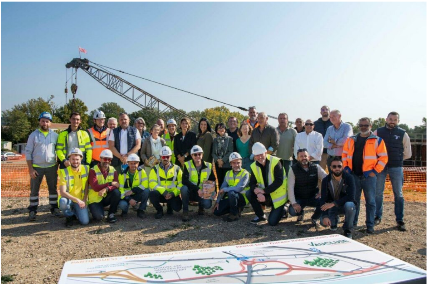
Une visite du chantier a été organisée ce mercredi 14 octobre.

Ce nouveau giratoire devrait être mis en service à la fin de l'année et des modifications de circulation seront aussi mises en place au travers de deux voies provisoires à la sortie de l'autoroute vers les Bouches-du-Rhône et à la sortie de l'autoroute vers Avignon. Tous les accès au péage d'Avignon Sud se feront à partir du nouveau carrefour giratoire.