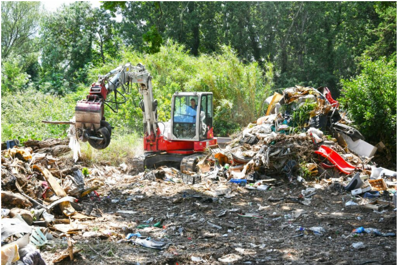
Nettoyage chemin de Baigne-Pied le 12 juin