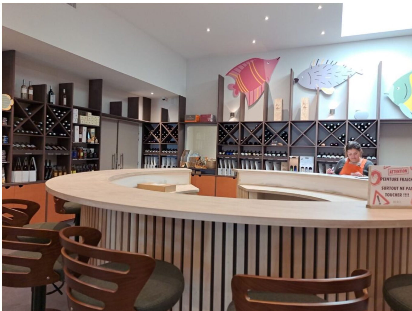
Espace de dégustation des vins