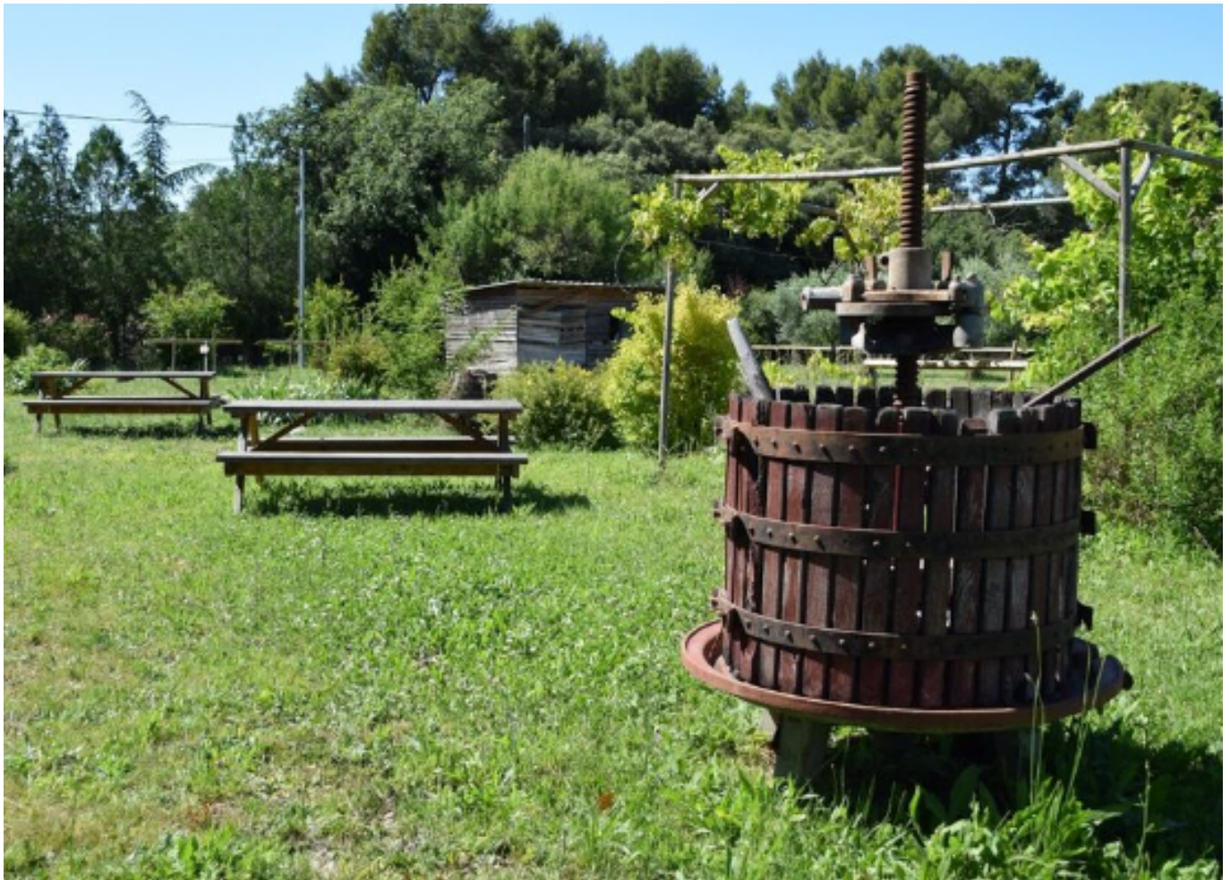
La ferme du Rouret à Mazan