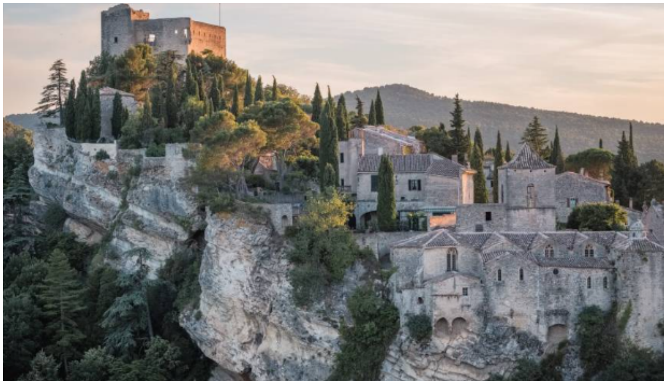
Vaison la Romaine