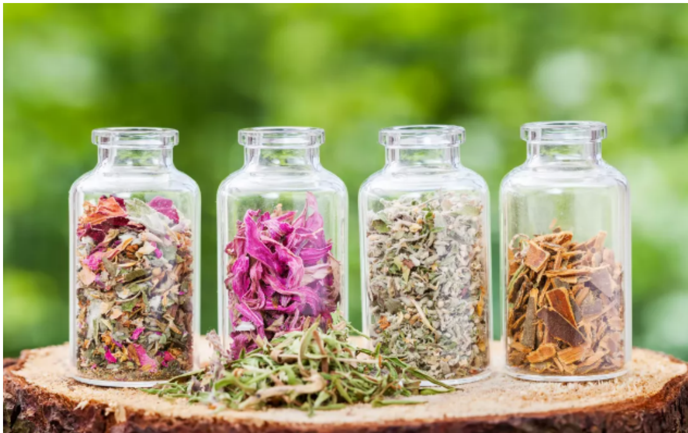
Plantes médicinales DR