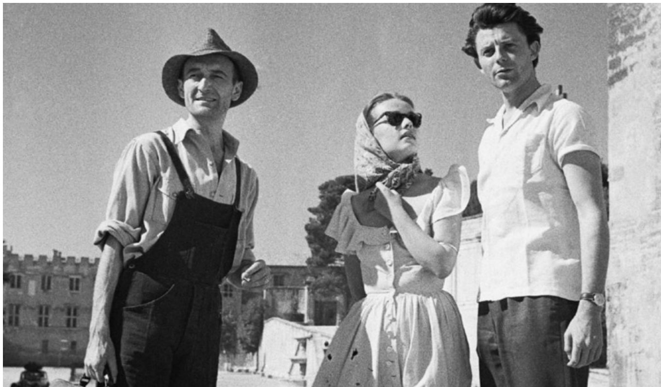
Jean Vilar, Jeanne Moreau et Gérard Philippe sur la place du Palais des Papes devant le Musée du Petit Palais