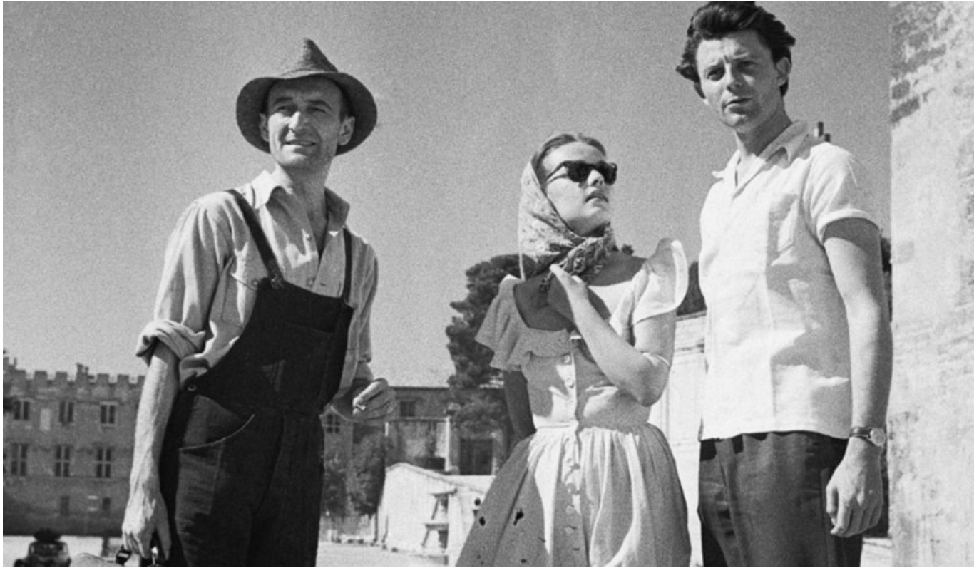
Jean Vilar, Jeanne Moreau et Gérard Philippe sur la place du Palais des Papes devant le Musée du Petit Palais