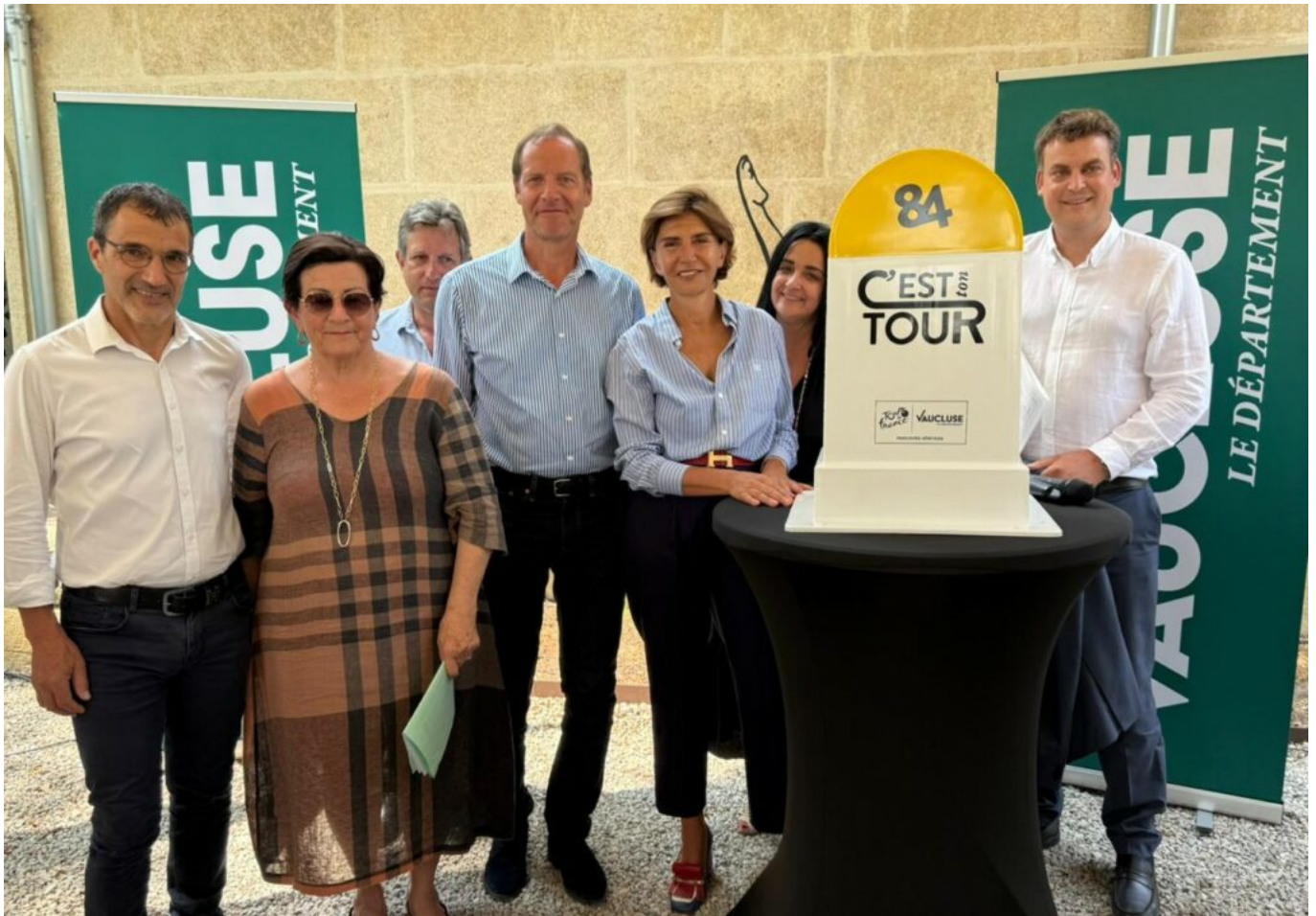
Christian Prudhomme, directeur du tour de France, avec les élus de Vaucluse.