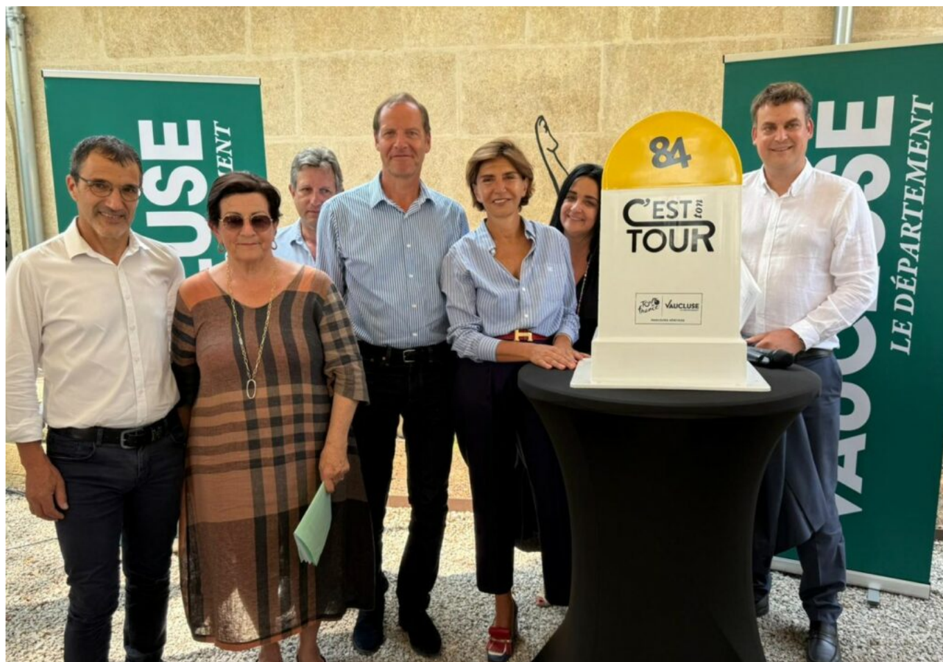
Christian Prudhomme, directeur du tour de France, avec les élus de Vaucluse.