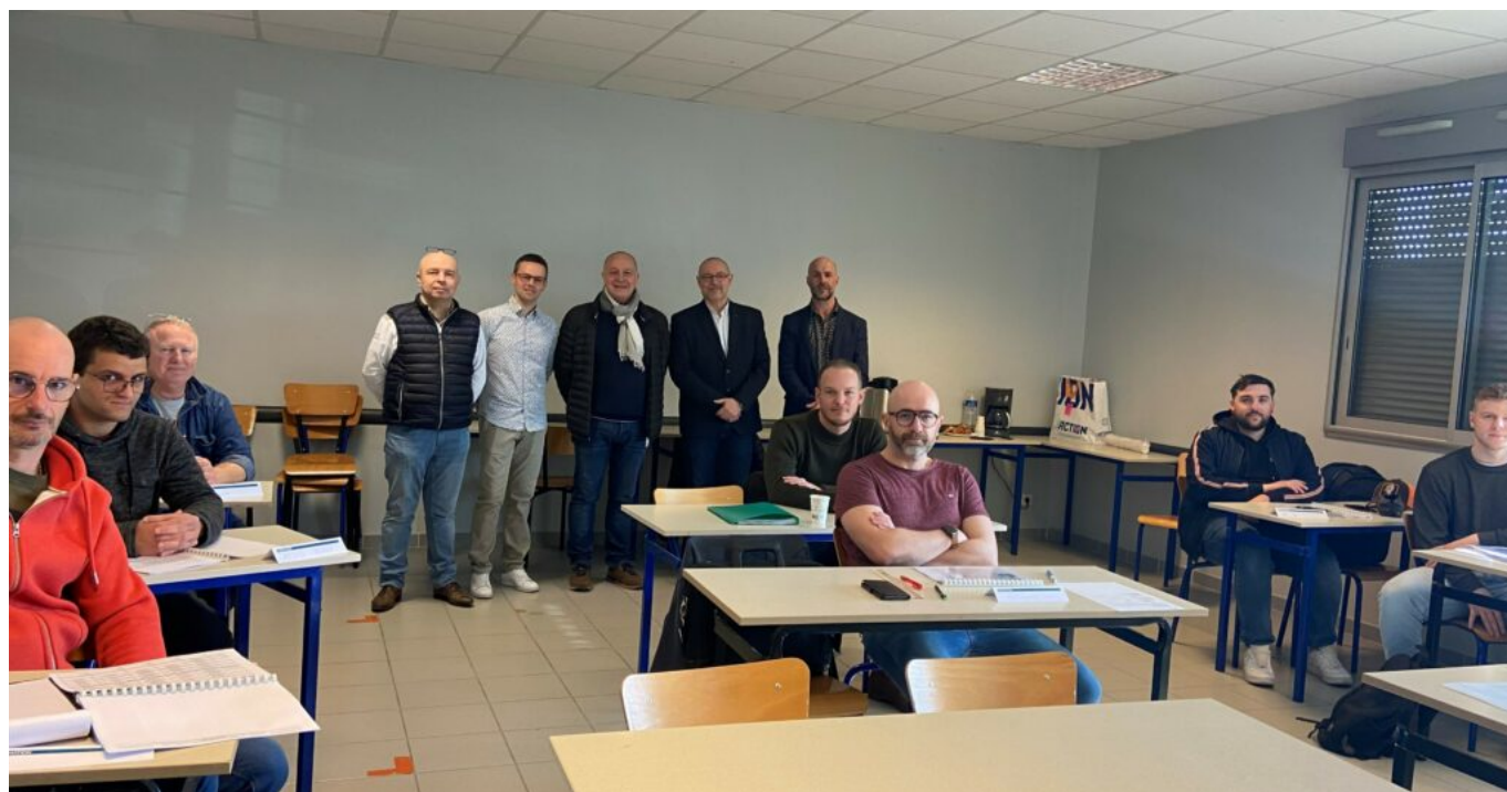
Lancement de ce nouveau parcours avec, au premier plan les stagiaires, et en arrière-plan

Grâce à la collaboration entre Apave et Nextech, les stagiaires pourront apprendre dans des conditions réelles au sein d'ateliers et de matériels de soudage de tous types mis à disposition par le centre de formation. L'objectif de la création de ce parcours est de répondre à un besoin concernant un métier en tension.