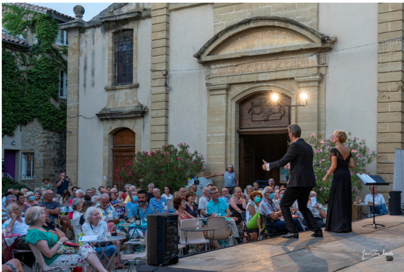
Festival Durance Luberon édition 2021