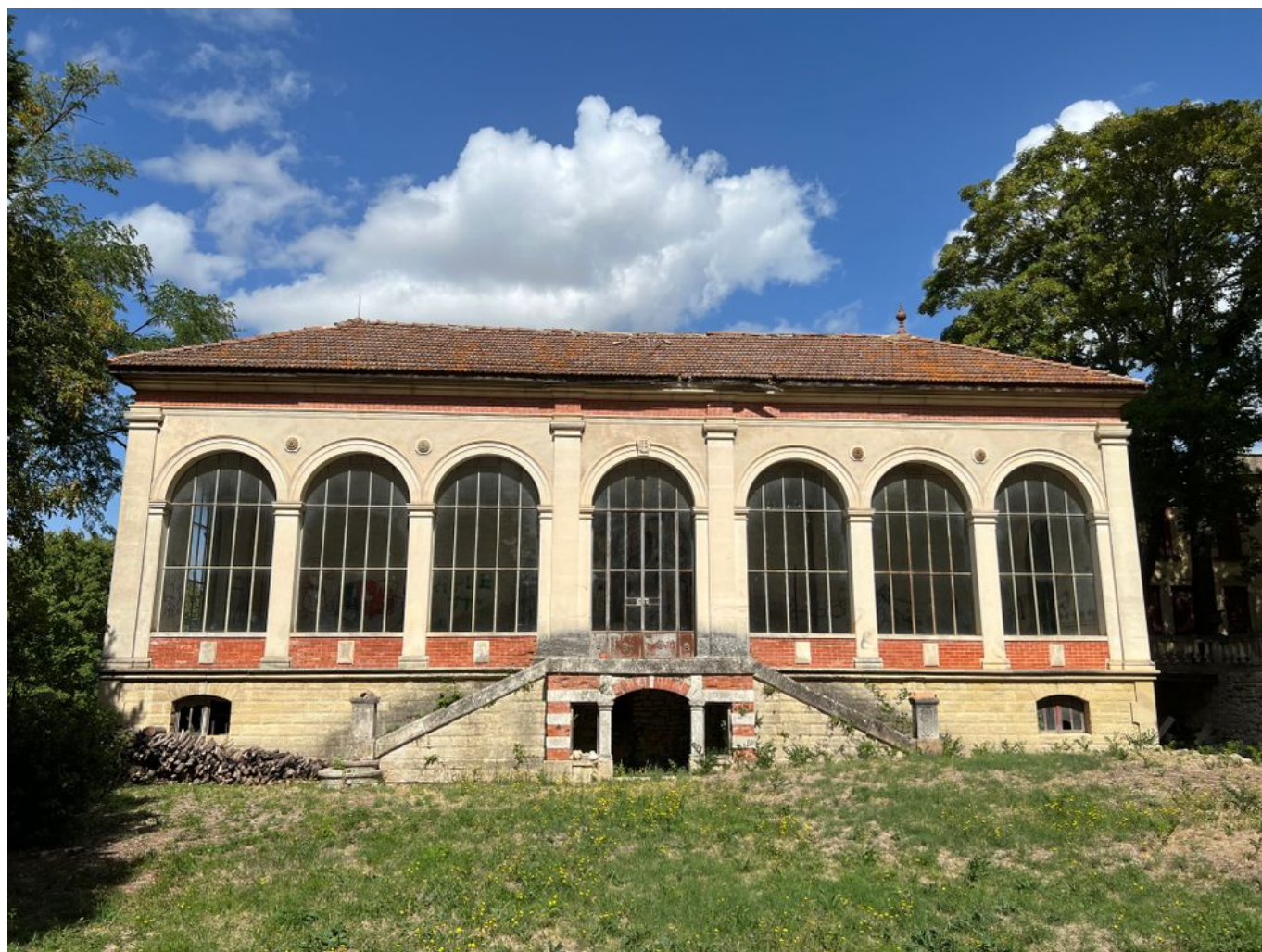
L'orangerie du Château de Thézan.

Depuis la première édition, la Mission Patrimoine a aidé plus de 950 sites pour leurs travaux de restauration. Plus de 70% d'entre eux sont d'ores et déjà sauvés : 340 sont terminés et 280 chantiers sont en cours. Pour l'édition 2024, plus de 790 nouveaux projets ont été signalés. Comme chaque année, la Mission Patrimoine en a sélectionné 100, dont un en Vaucluse : l'orangerie du Château de Thézan à Saint-Didier.