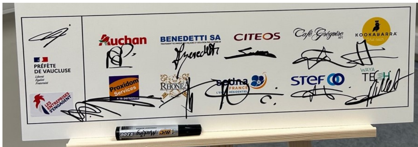
Les 10 nouvelles entreprises signataires de la convention.

Soutenues par l'Etat qui les accompagnent dans cette démarche via notamment la Direction départementale de l'emploi, du travail et des solidarités (DDTES) de Vaucluse, ces entreprises s'engagent à sensibiliser les plus jeunes au monde de l'entreprise afin que ces derniers aient « une meilleure compréhension du monde de l'entreprise, de secteurs d'activité et des métiers d'aujourd'hui et de demain ».