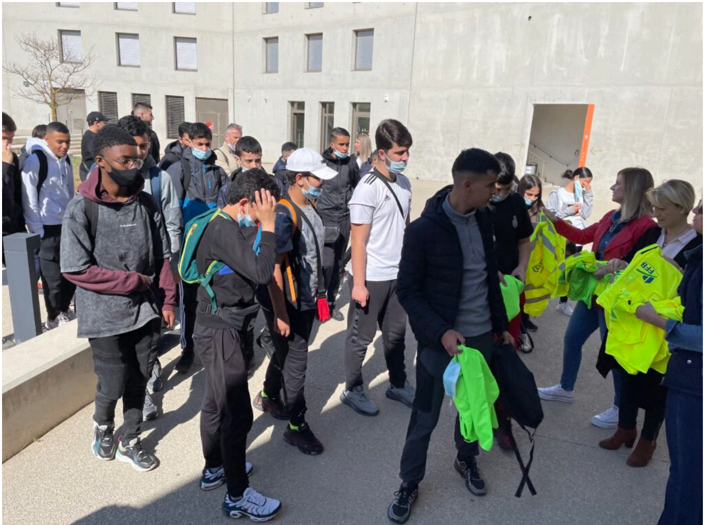
Accueil des collégiens et lycéens à l'ECIR de Mallemort en Provence par l'équipe de la Fédé du BTP 84