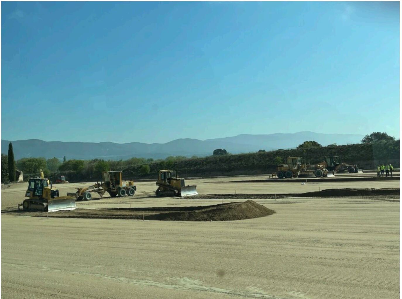
Exercices de terrassement