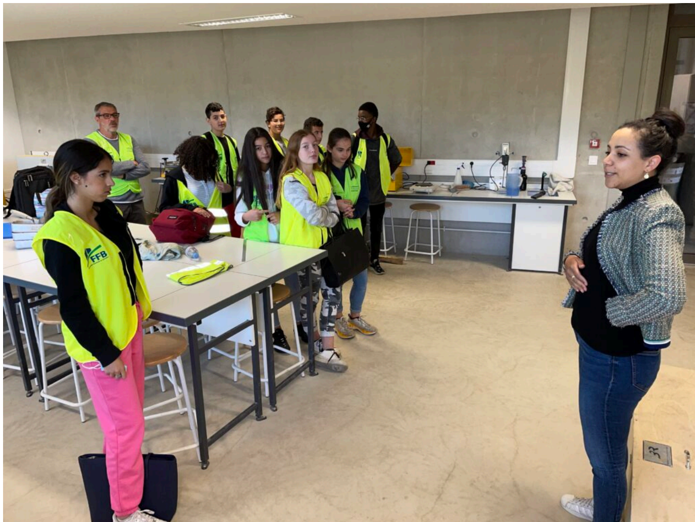
Présentation du laboratoire dévolu aux étudiants en licence et diplôme d'ingénieur