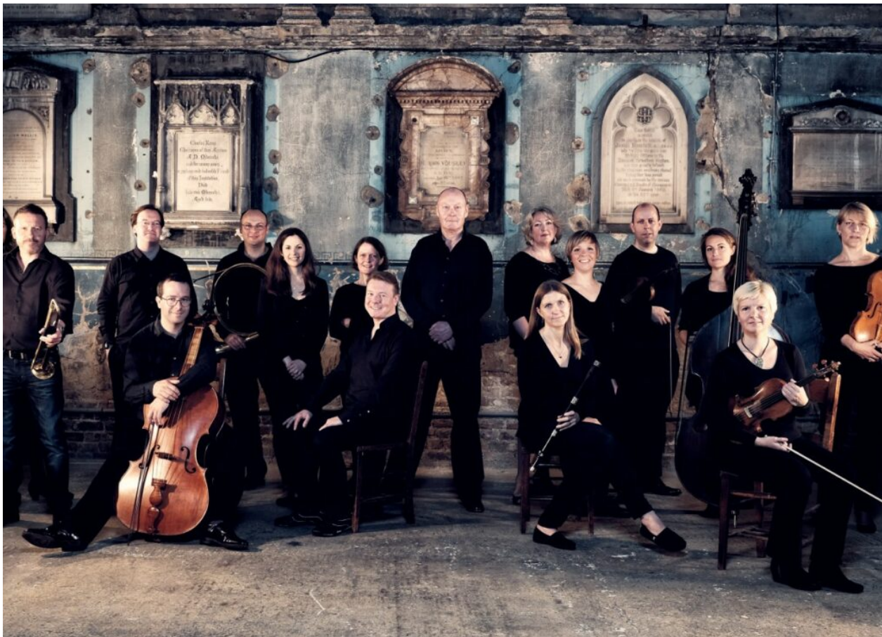
“King Arthur” par le Gabrieli Consort le 09 juillet place de l'Horloge à Ménerbes

A Ménerbes le 9 juillet, mais en plein air sur la Place de l'Horloge l'opéra « King Arthur » de Purcell qui sera dirigé par le londonien Paul Mac Creesh à la tête de son Ensemble Gabrieli Consort & Players et de sopranos, ténors baryton et baryton-basse réputés.