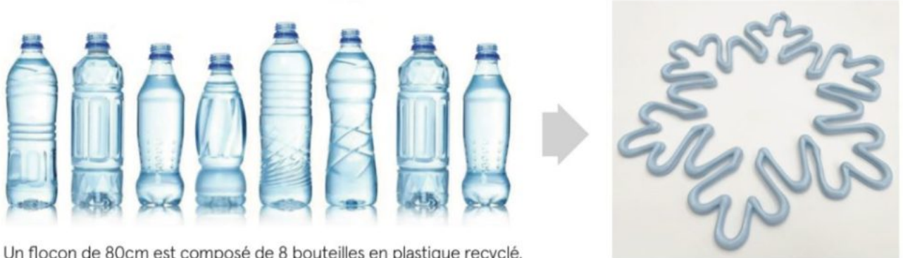
Un flocon de 80cm est composé de 8 bouteilles en plastique recyclé.