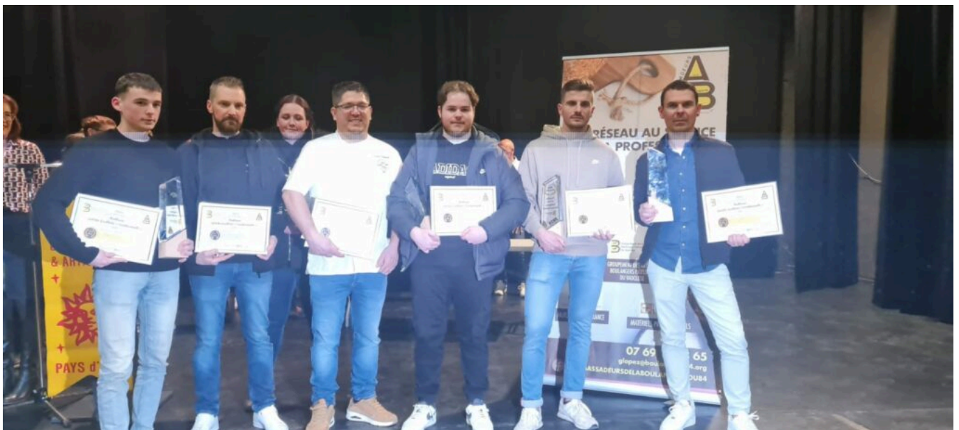
Une partie des lauréats.