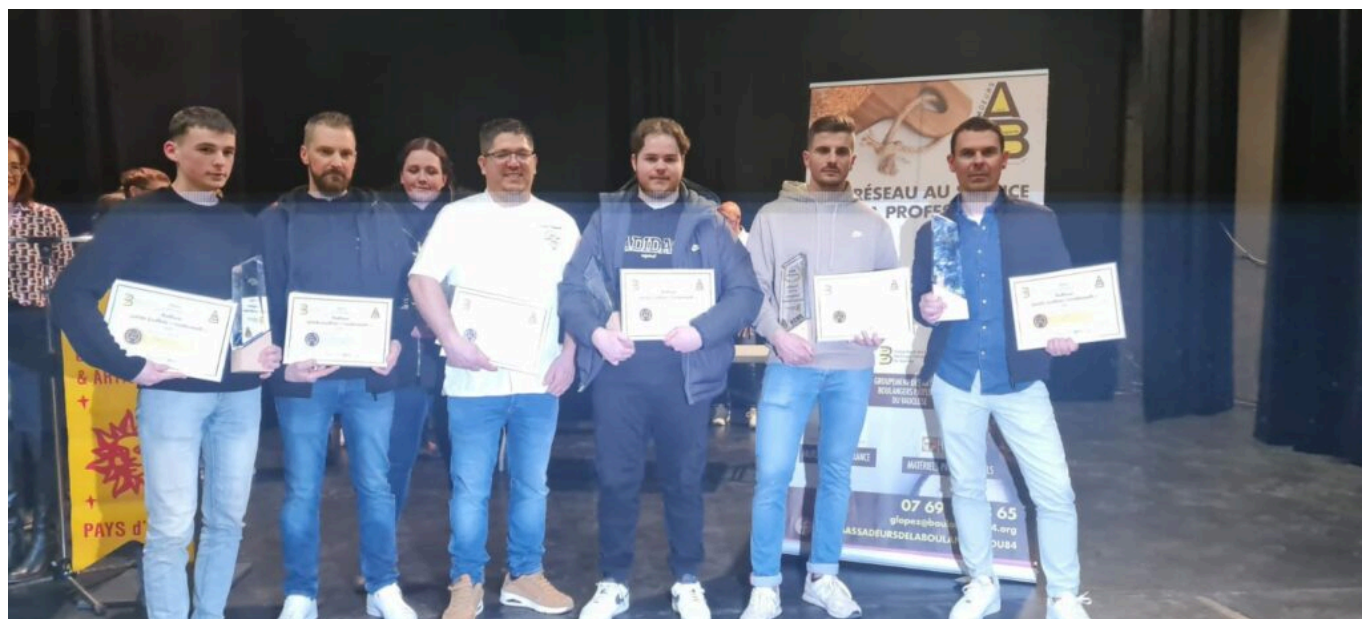
Une partie des lauréats.