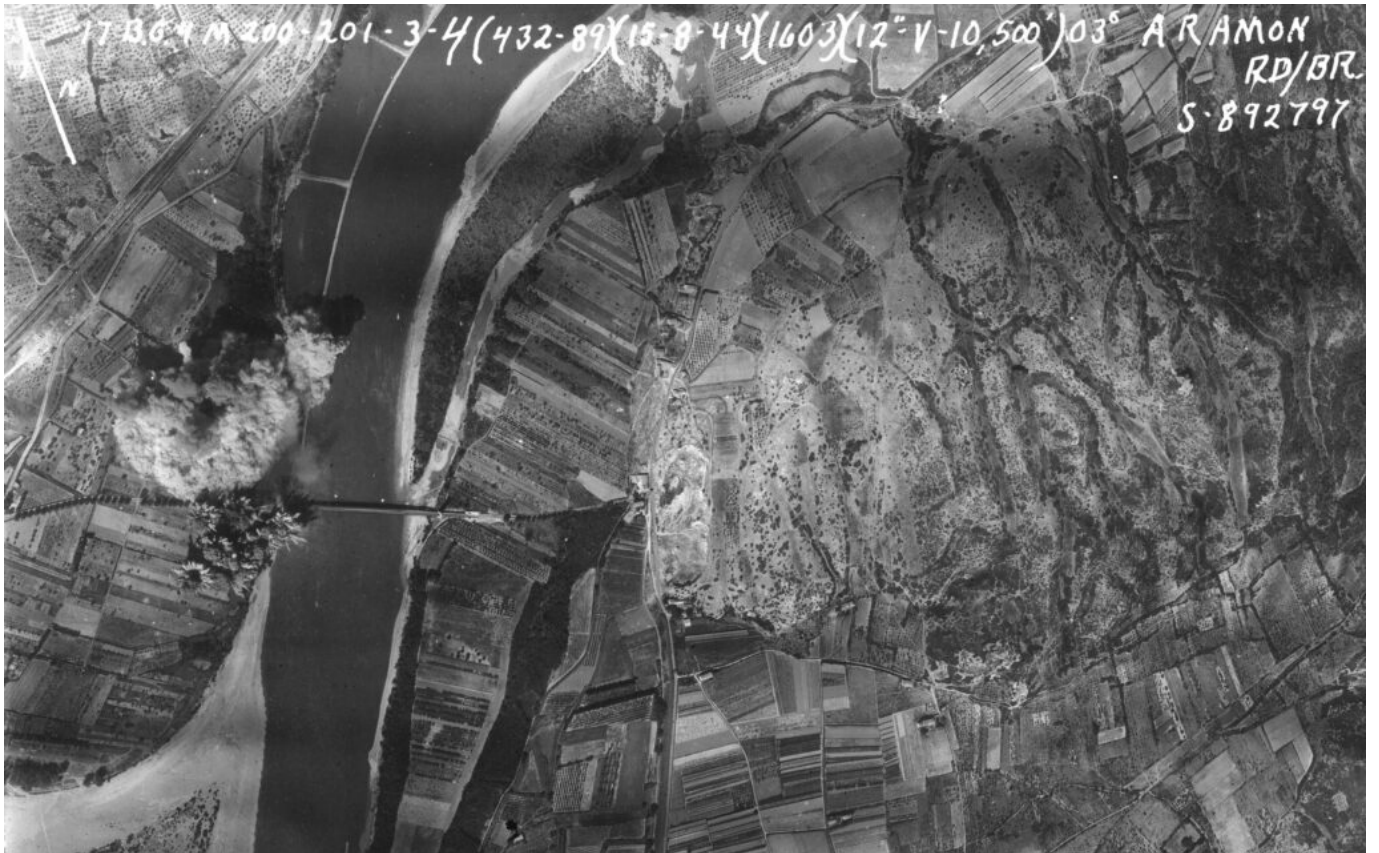
15 août 1944, 16h03 : les bombes larguées par les appareils du 17th Bomb Group explosent autour de l'extrémité Ouest du pont routier d'Aramon.