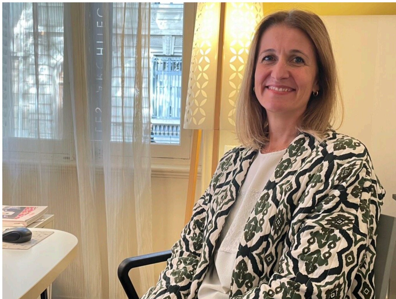
Carole Nègre Copyright MMH