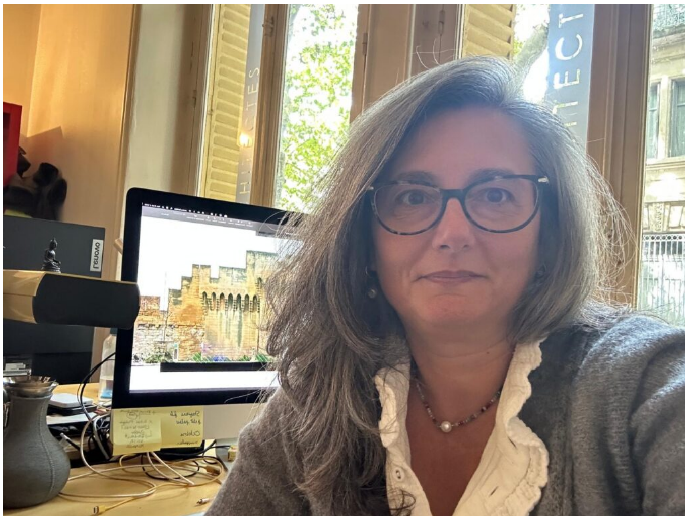
Raffaella Telese Copyright D3