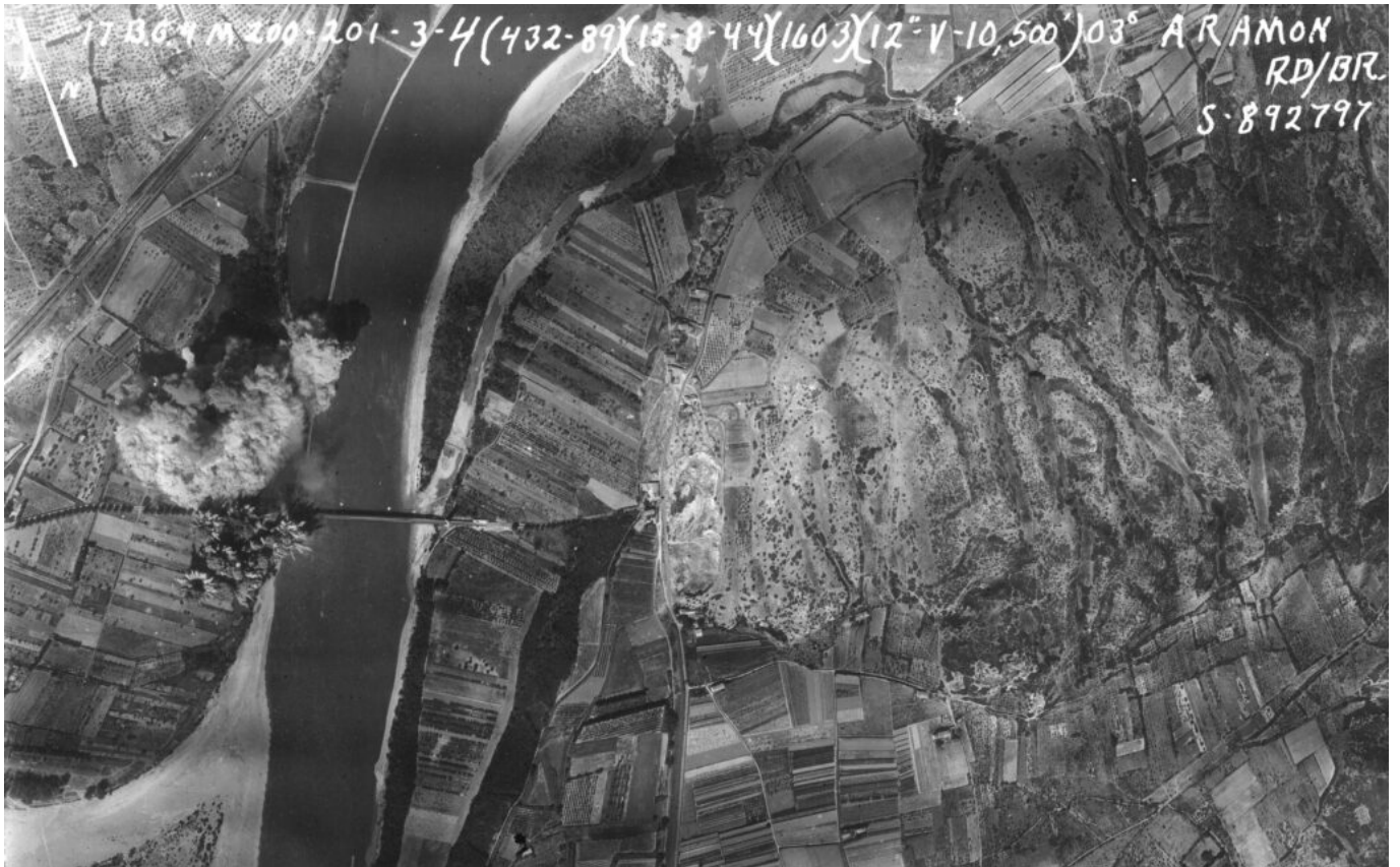
15 août 1944, 16h03 : les bombes larguées par les appareils du 17th Bomb Group explosent autour de l'extrémité Ouest du pont routier d'Aramon.