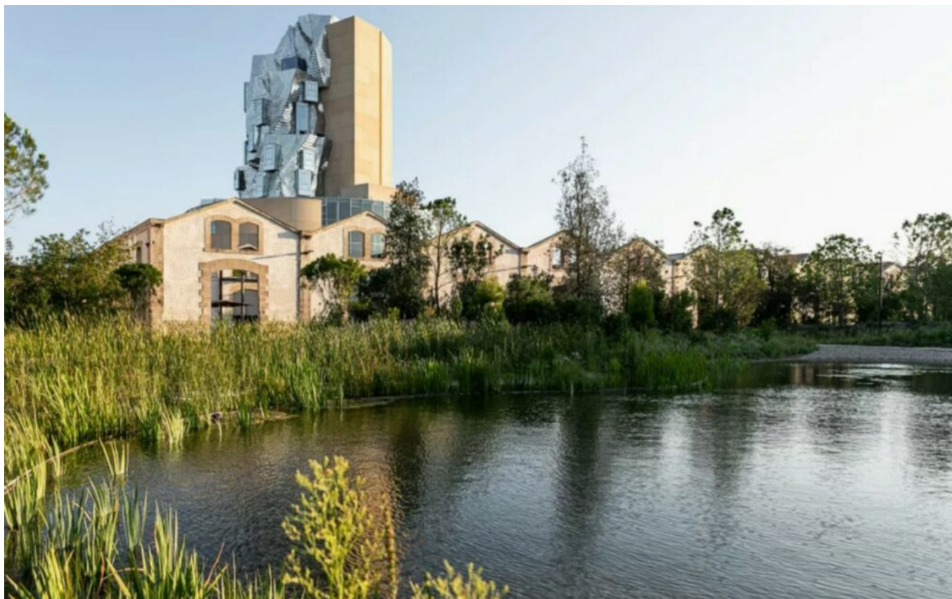
Le parc des ateliers de la Luma à Arles, Grand prix 2024 des victoires du paysages.

« Les principes de conception et les différents partenariats ont permis de développer un projet résilient qui s'adresse aux enjeux du XXI e siècle, explique le jury de Valhor. Espace ouvert à tous publics, le parc des Ateliers fait l'éloge de la diversité paysagère de la région en y évoquant la Camargue, la Crau et les Alpilles. L'étang et les quelque quatre-vingt mille arbres, arbustes et sous-arbrisseaux permettent ainsi de rafraîchir l'atmosphère et offrent les conditions favorables pour l'installation d'insectes, d'oiseaux, de batraciens et de chauve-souris. Le travail sur la topographie tenant compte du rôle du vent, l'ingénierie hydraulique et l'étude des strates du sol conduisant à création de réserves d'eau de ruissellement intégrées sont des gages de l'autonomie à terme du parc en matière de gestion du manque d'eau. »