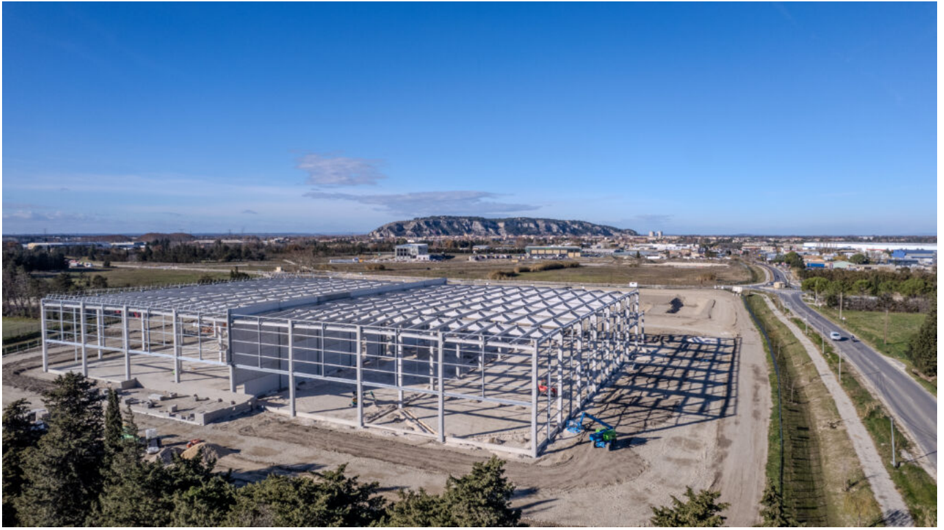
ZA des Hauts-Banquets