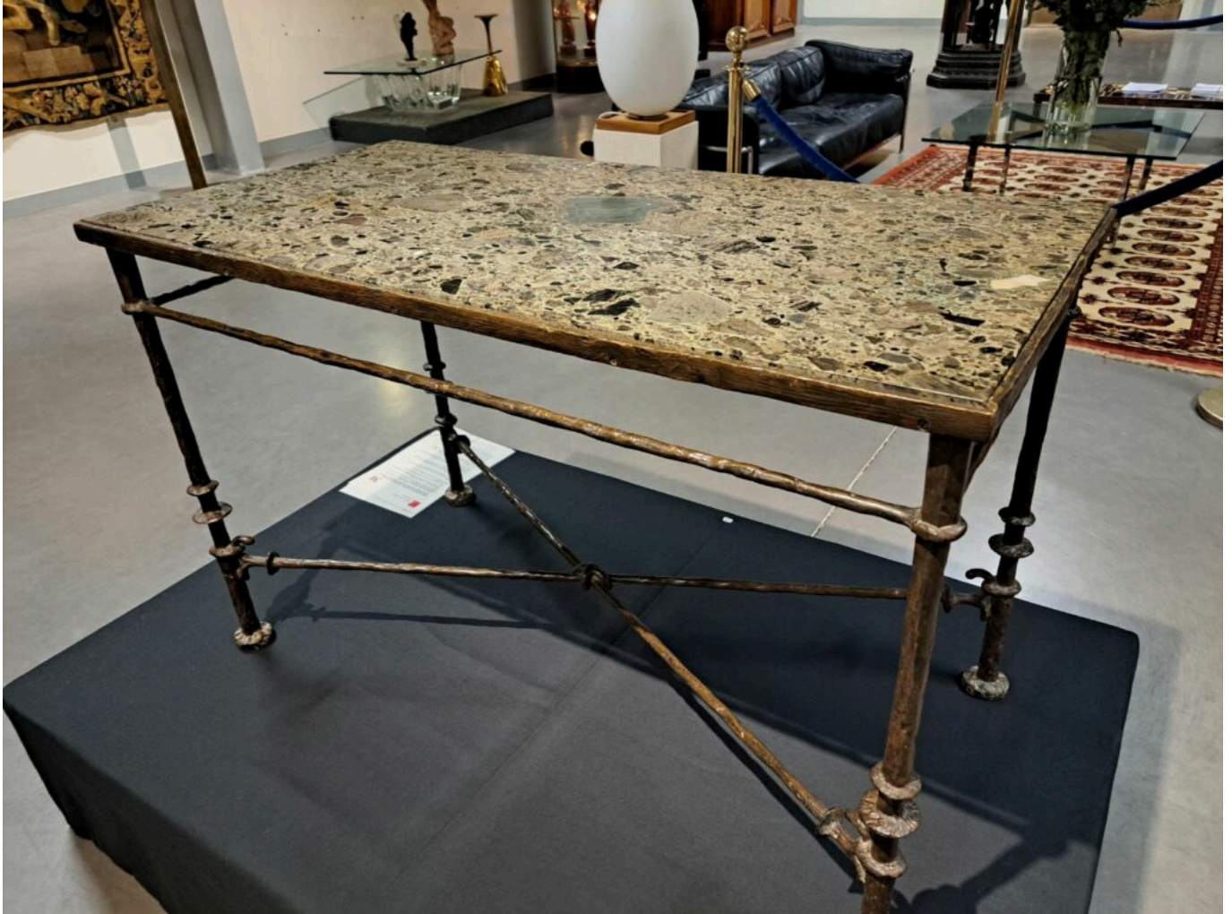
La console de Diego Giacometti a grimpé à 676 000€

d'enchères, le 16 décembre avec des vins d'exception, à quelques jours des repas de fêtes.