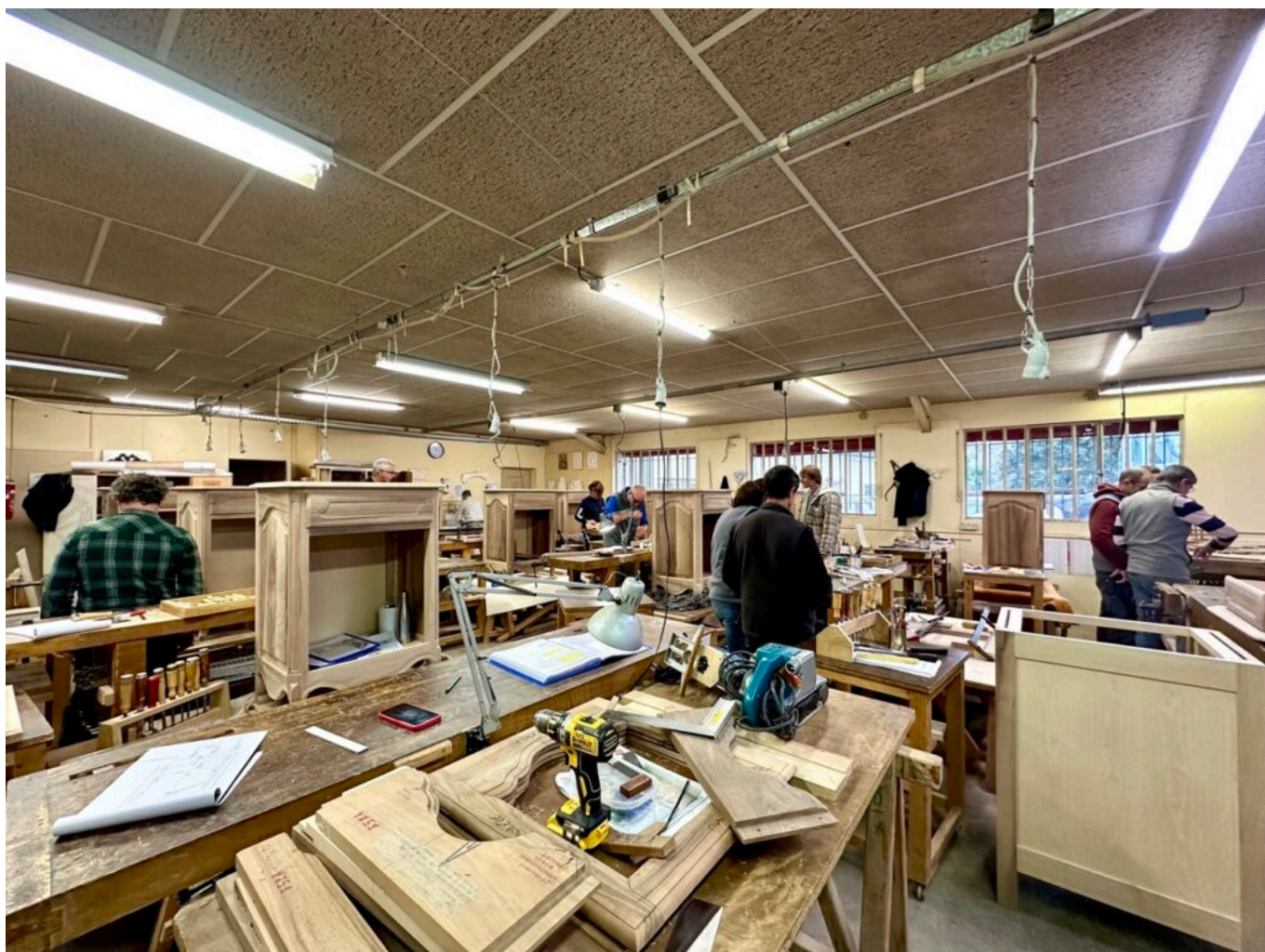
Un des deux ateliers d'ébénisterie.