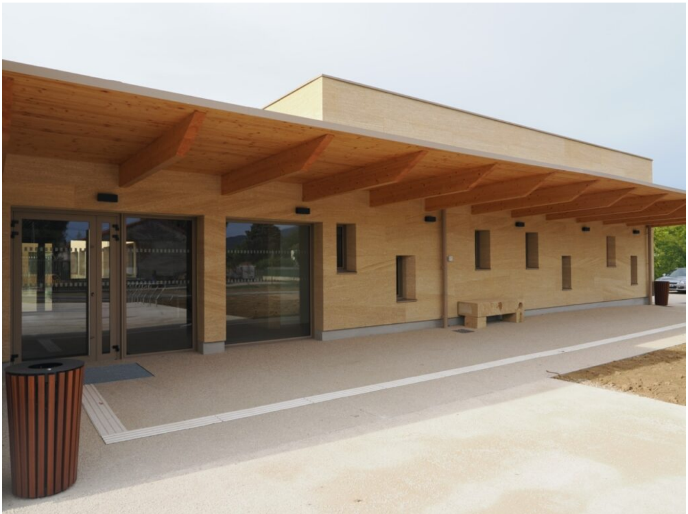
La salle Sandrine Martinet

La salle Sandrine Martinet sera inaugurée le samedi 12 octobre à 18h en présence de la championne paralympique.