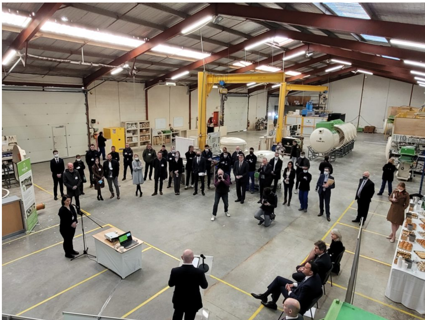
Présentation de Tricel au sein de l'usine de Sorgues.

C'est en 2016 que l'entreprise de construction de micro-stations d'épuration a choisi Sorgues pour implanter son second site français de fabrication et de distribution, après celui de Poitiers. Une implantation notamment réussie grâce au concours de l'agence économique Vaucluse Provence Attractivité et de l'agence irlandaise gouvernementale Enterprise Ireland .