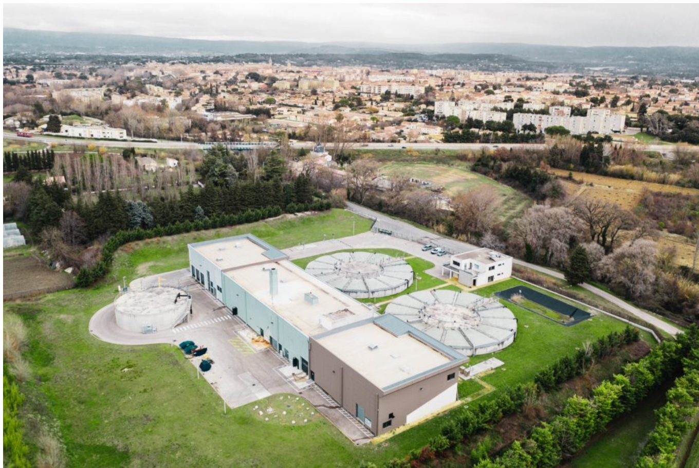
La station d'épuration des eaux usées de Carpentras.