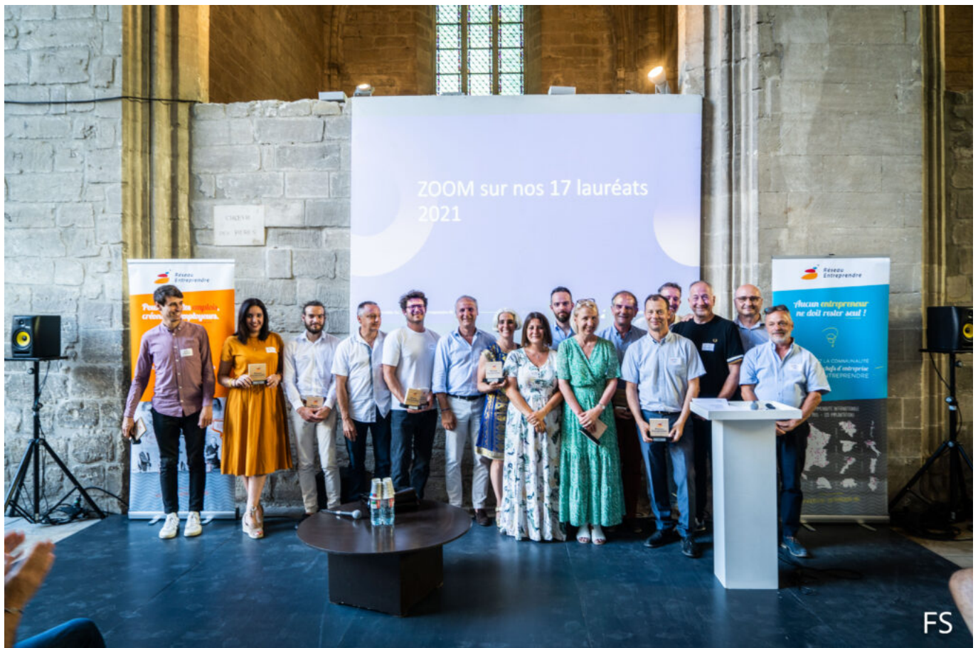
Les lauréats 2021 et les accompagnateurs du Réseau entreprendre Rhône-Durance.

Intégrée au réseau national créé en 1986 dans le Nord de la France, la section vauclusienne qui a vu le jour en 2003 avant de se transformer en associations départementales en 2013, couvre aujourd'hui l'ensemble du Vaucluse mais aussi le Nord des Bouches-du-Rhône ainsi qu'une partie du Gard rhodanien. Dans ce cadre, après avoir accompagné 10 lauréats en 2020, pour un total de prêts d'honneur de 430 000€, Réseau entreprendre Rhône-Durance en a soutenu 17 en 2021. Cela représente 11 entreprises lauréates (ndlr : il peut y avoir plusieurs lauréats pour une entreprise) : 5 créations, 4 reprises et 2 développements pour un montant total de 439 000€ de prêts engagés. De quoi créer et sauvegarder 193 emplois sur le territoire.