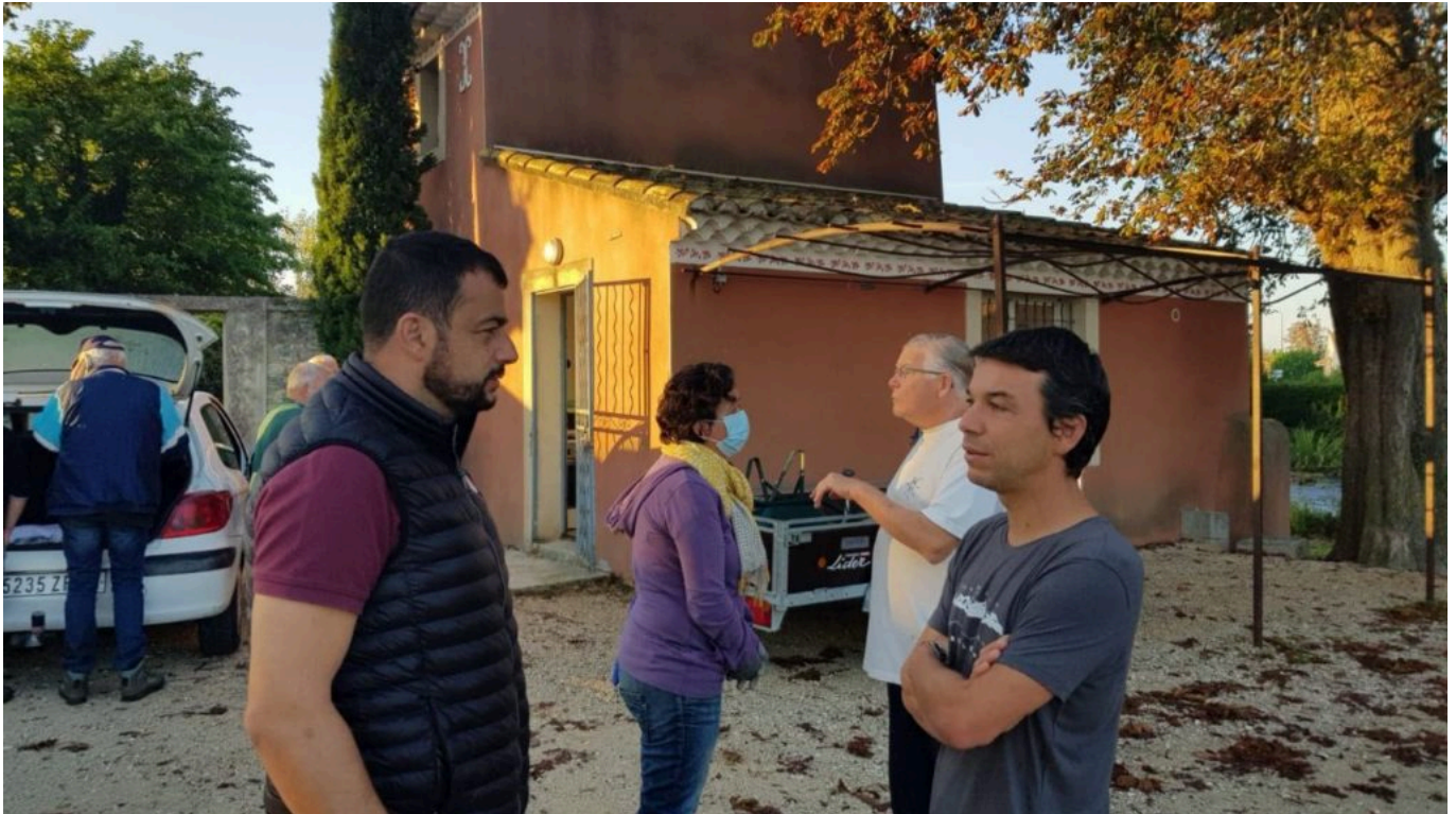
Maison de la pêche de Velleron à l'occasion du World Cleanup Day.