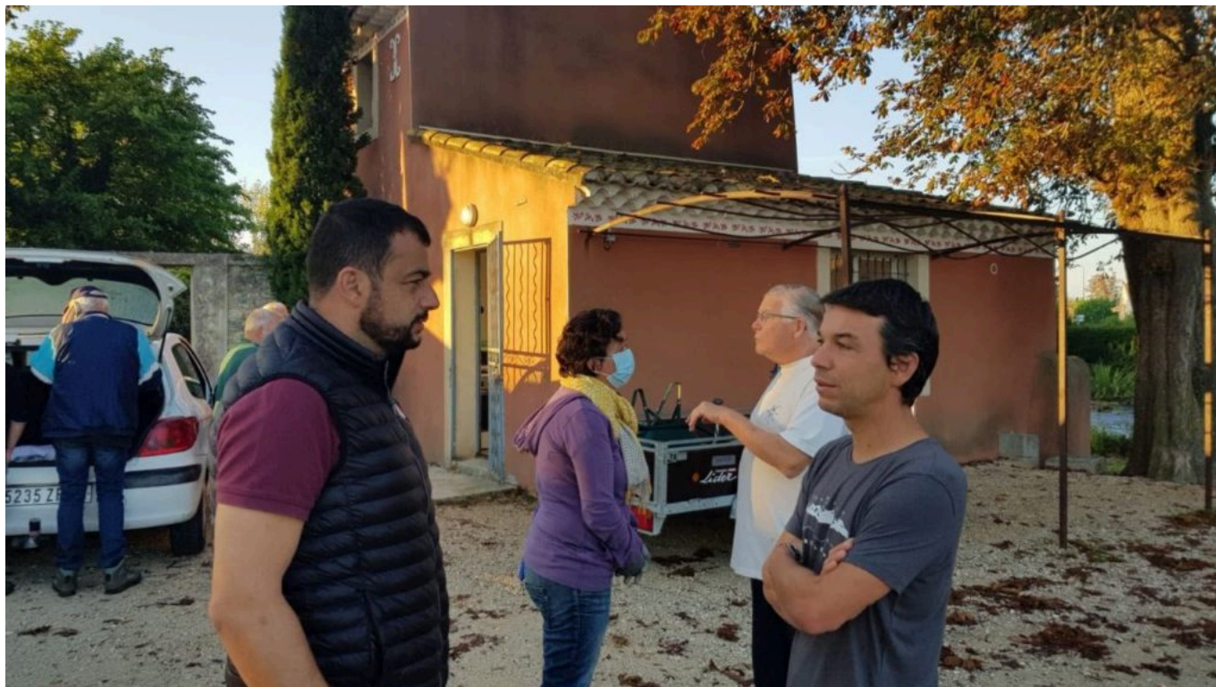
Maison de la pêche de Velleron à l'occasion du World Cleanup Day.